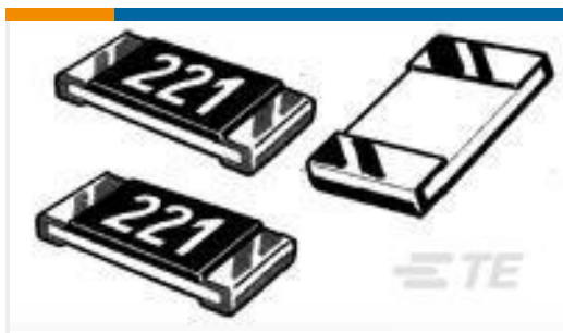
TE 产品编号1-2176232-4 3522 470K 1% 3W