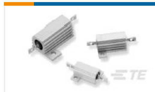
TE 产品编号1-1879075-7 THS25 2R7 5%