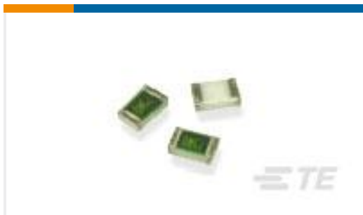
TE 产品编号1676659-2 RN 0805 17R4 0.1% 10PPM 1K RL