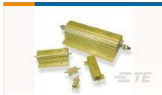
TE 产品编号3-1630019-6 HSC200 4R7 5%