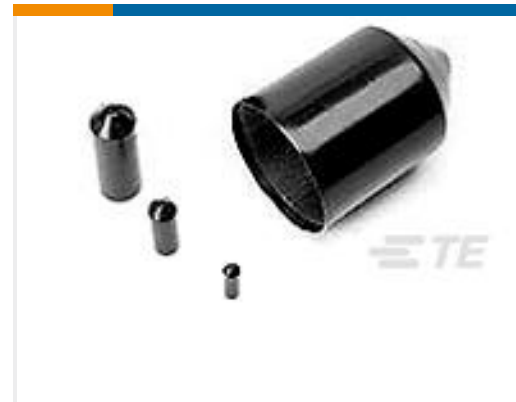
TE 产品编号843478-000 101A073-4/42-0