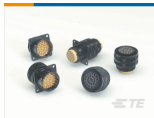
TE 产品编号ZPF000000000019292 FDBA 56-14-19 PW-K 090