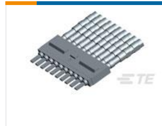
TE 产品编号697118-000 MTC100-JB1-P14