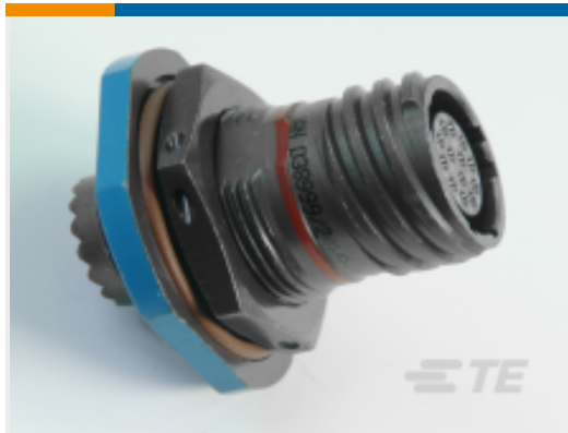
TE 产品编号YDTS24G25-24PAV001 RECP ASSY