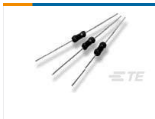
TE 产品编号4-1879350-4 RR01 5% 13R AMMO