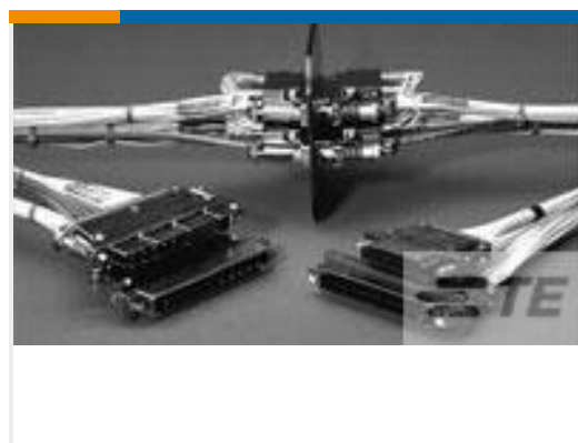
TE 产品编号605415-000 MTC100-BJ2-P23