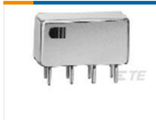
TE 产品编号2-1617039-6 HMS1201S110L = M39016/44-026L