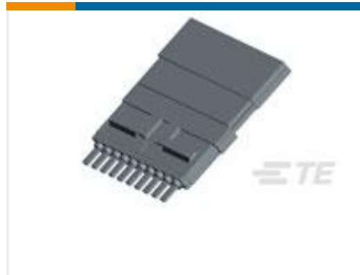
TE 产品编号750359-000 MTC100-EA1-P12