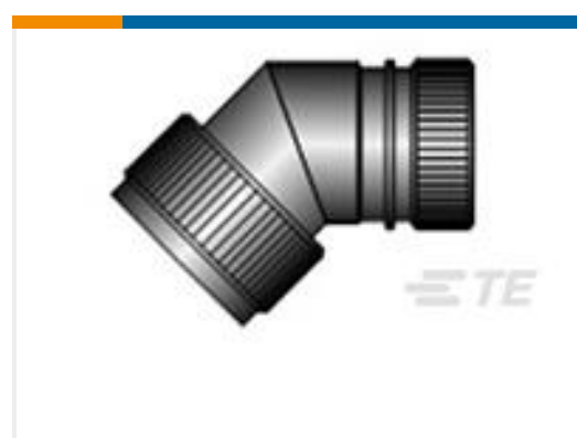
TE 产品编号CZ6862-000 HEX40-AC-45-25-A12-3