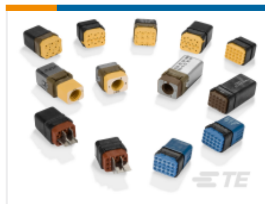
TE 产品编号ZPF000000000015141 DMC-M 01-08 AB