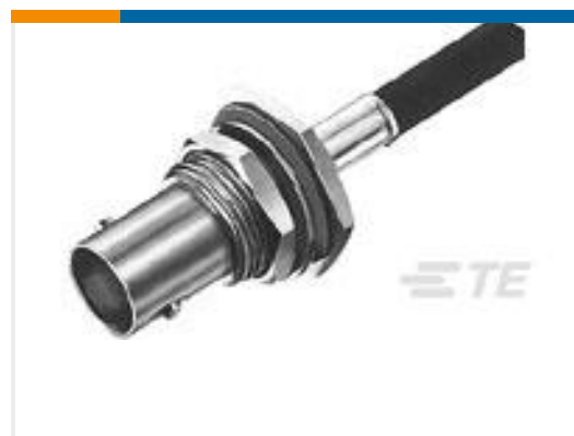
TE 产品编号225398-6 CONNECTOR, BNC DUAL CRIMP JACK