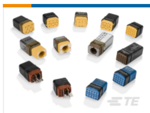
TE 产品编号ZPF000000000203708 DMC-M 99-10 PC