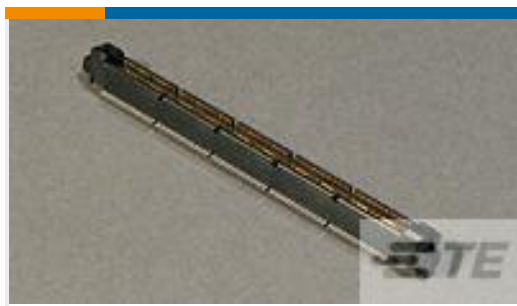
TE 产品编号767056-5 MICT,260,PLUG,190,ASSY,PDNI