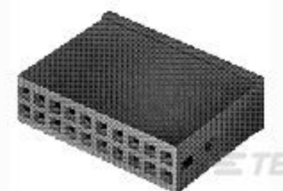
TE 产品编号 87132-2 10 LOCKING CLIP HSG DR .100CL