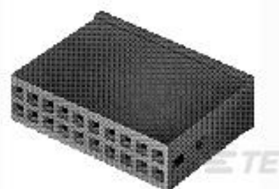
TE 产品编号 87131-2 10 LOCKING CLIP HSG DR .100CL