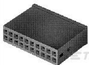
TE 产品编号 87133-5 10 LOCKING CLIP HSG DR MRKD