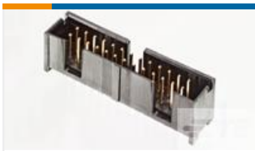
TE 产品编号103309-3 016 LOPRO HDR SP 30DP