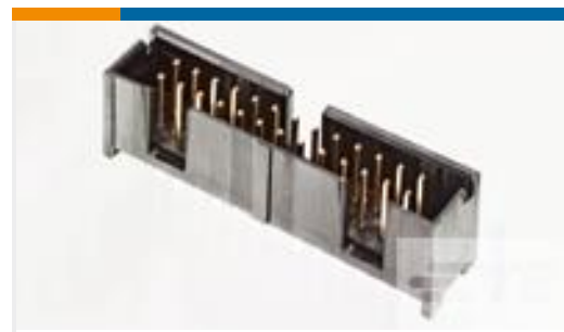
TE 产品编号103309-5 020 LOPRO HDR SP 30DP