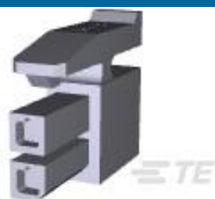
TE 产品编号794617-2 2POS, MICRO MNL, RCPT HSG