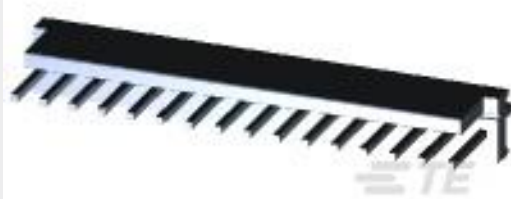
TE 产品编号1-640454-6 16P MTA100 HDR ASSY SQ STR POL