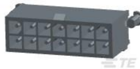
TE 产品编号1-794067-0 14P MINI UMNL HDR W/DH SN