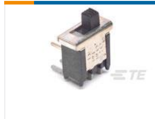
TE 产品编号1571982-2 TSS11DG1PC04=SLIDE SWITCH SPDT