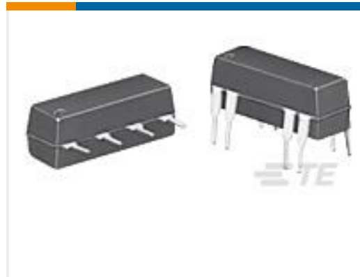
TE 产品编号3-1393771-4 JWS-117-3=REED RELAYS