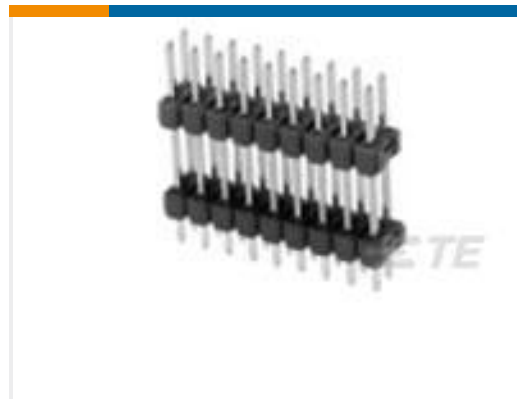
TE 产品编号146507-2 04 MODII HDR DRST UNSHRD STKG