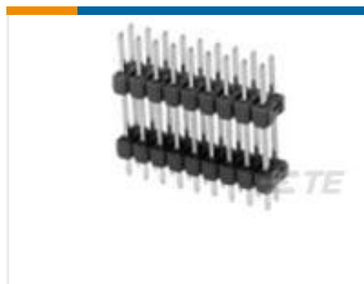
TE 产品编号146507-2 04 MODII HDR DRST UNSHRD STKG