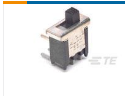
TE 产品编号1571982-4 TSS11EGPC04=SLIDE SWITCH SPDT