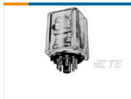
TE 产品编号4-1393100-2 KCP-5-10000=KA/KB/KC/KR