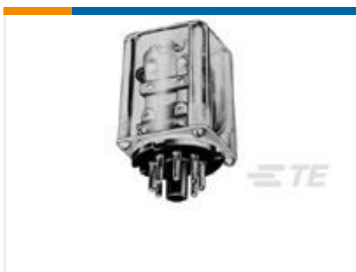
TE 产品编号3-1393100-8 KCP-11-10000=KA/KB/KC/KR