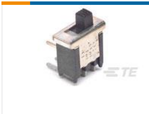
TE 产品编号1571982-3 TSS11EG1PC04=SLIDE SWITCH SPDT