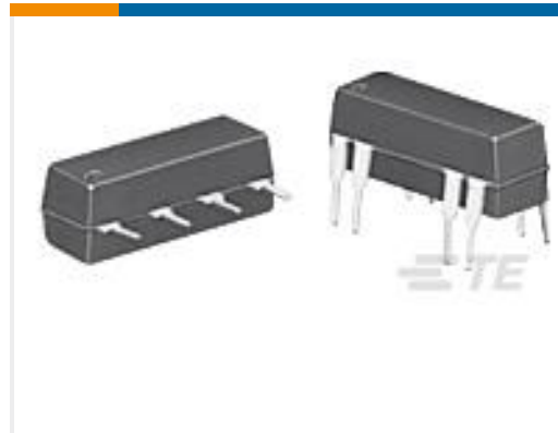
TE 产品编号3-1393771-4 JWS-117-3=REED RELAYS