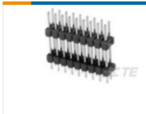
TE 产品编号146507-2 04 MODII HDR DRST UNSHRD STKG