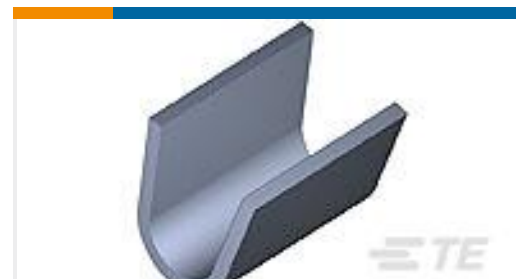
TE 产品编号1217967-1 SPLICE 8500-14000 .025 BR