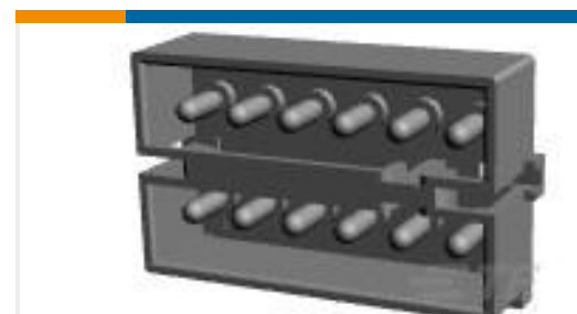
TE 产品编号1586520-2 12P CMNL HDR ASSY PC NATL LF