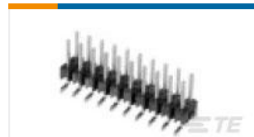
TE 产品编号146130-6 14 MODII HDR DRST SFMNT B/A