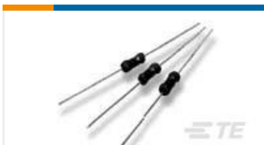
TE 产品编号2-1879351-1 RR01 5% 20K AMMO