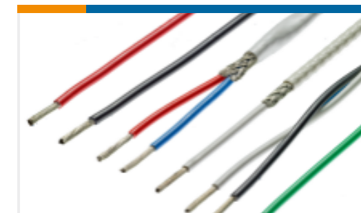
TE 产品编号3830743001 44A0121-22-9/9