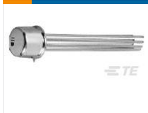
TE 产品编号3-1617545-3 MAC-5S=MA T05 RELAY