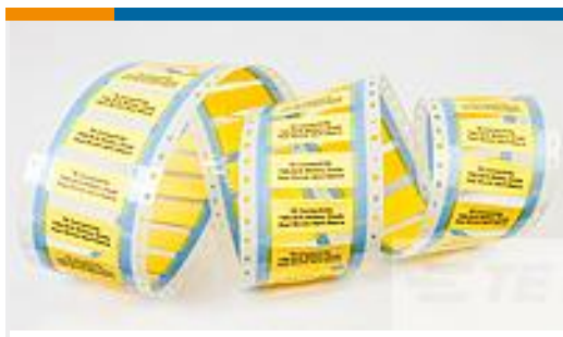
TE 产品编号2983910001 TMS-SCE-1-1/2-2.0-S1-9