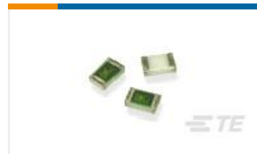
TE 产品编号1676310-1 RN 0805 34K8 0.1% 10PPM CUT LENGTH