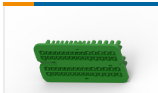
TE 产品编号284939-4 MULTIPLE CAVITY PLUG 60W