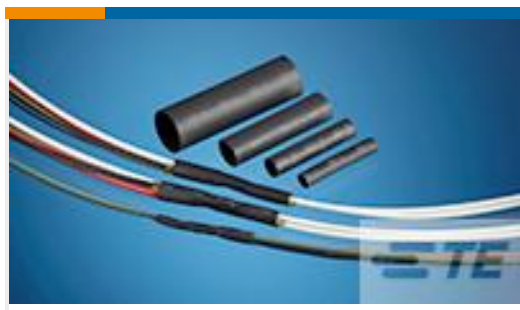
TE 产品编号8208596007 RBK-ILS-125-3A-0-40MM