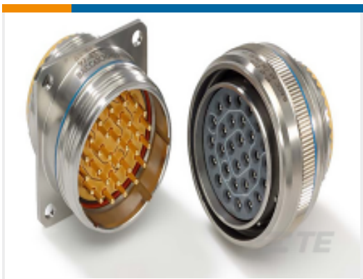
TE 产品编号 ZPF000000000007333 983-0S 10-06 P6 L