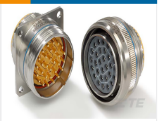
TE 产品编号 ZPF000000000007165 983-ORS 08-03 P7 L