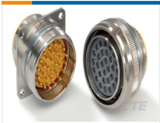
TE 产品编号 ZPF000000000007309 983-0S 08-03 PN-L