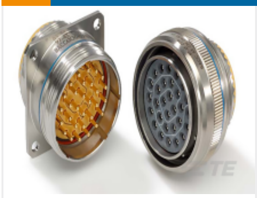
TE 产品编号 ZPF000000000007163 983-ORS 08-03 P6 L