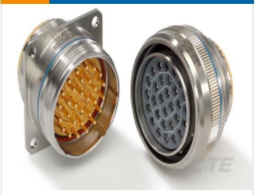
TE 产品编号 ZPF000000000007177 983-ORS 10-05 P7 L