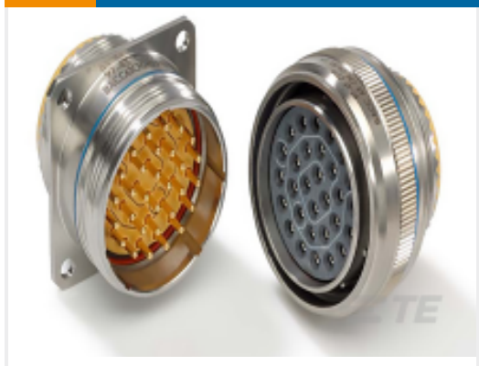
TE 产品编号 ZPF000000000007169 983-ORS 08-03 PN-L