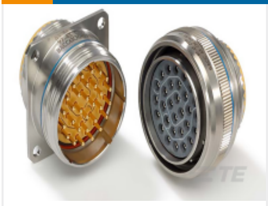
TE 产品编号 ZPF000000000007176 983-ORS 10-05 P6 L