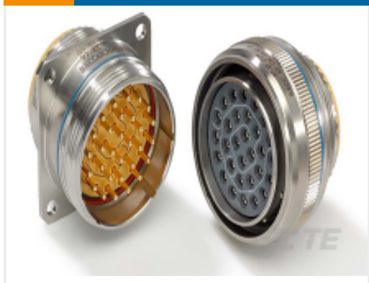
TE 产品编号 ZPF000000000007166 983-ORS 08-03 P8 L