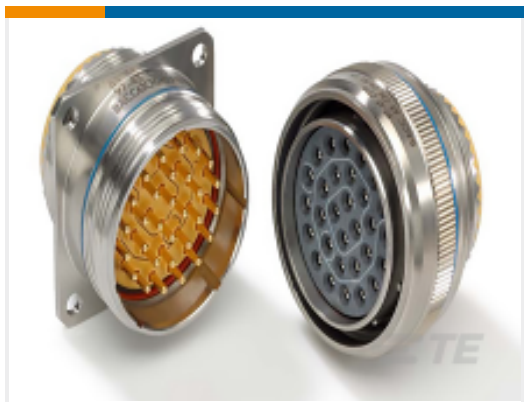
TE 产品编号 ZPF000000000008558 983-6S 10-06 PN-L