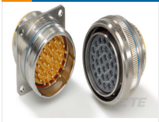
TE 产品编号 ZPF000000000007181 983-ORS 10-05 PN-L