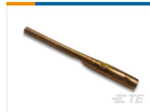
TE 产品编号543382-5 INSERT/EXTRACT TIP 25-KIT