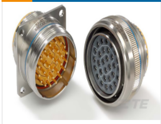
TE 产品编号 ZPF000000000007179 983-ORS 10-05 P8 L