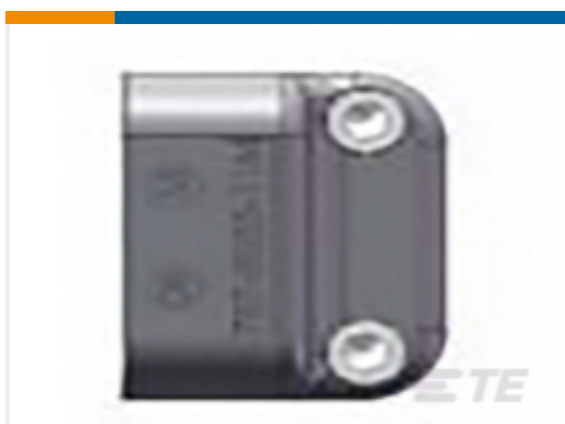
TE 产品编号ZPF00000000107200 787-8055-11M