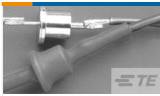
TE 产品编号5677874004 RNF-3000-12/4-9-SP