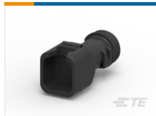
TE 产品编号1011-267-0605 BKSHL, 6P, BLK, PLG, ST, SR, NW8.5 /10/13