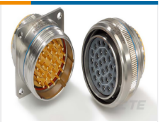
TE 产品编号 ZPF000000000107105 983-0A 10-05 PN-A285