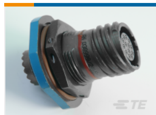
TE 产品编号YACT24MC04ANV00100 JAM NUT RECEPTACLE