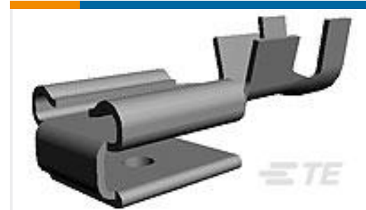
TE 产品编号60279-2 FASTON 250 14-18AWG TPBR