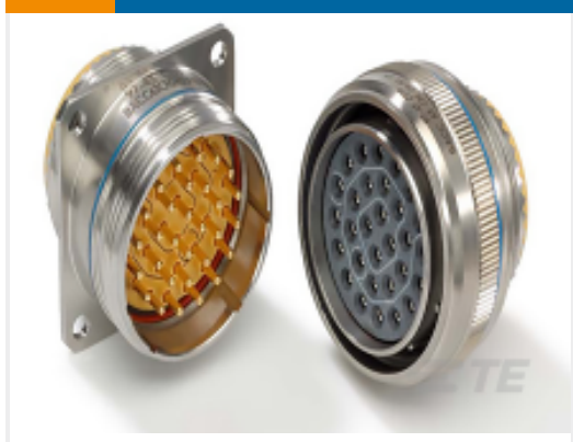
TE 产品编号 ZPF000000000103572 983-0A 12-12 PN-L