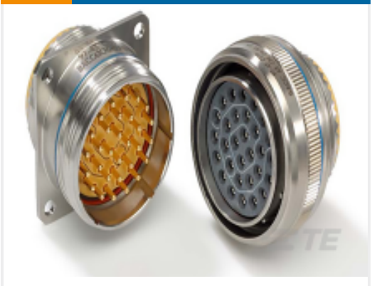
TE 产品编号 ZPF000000000007187 983-ORS 10-06 PN-L