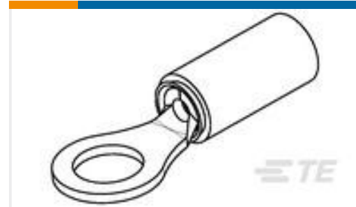
TE 产品编号1577633-1 TERMINAL RT PIDG PEEK STRATO 18-16 AWG