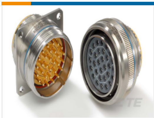
TE 产品编号 ZPF100000000007327 983-0S 10-05 PN-L