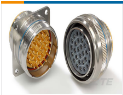
TE 产品编号 ZPF000000000007319 983-0S 10-05 P6 L