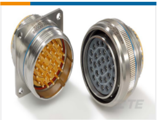
TE 产品编号 ZPF000000000008610 983-6S 14-15 P6 L