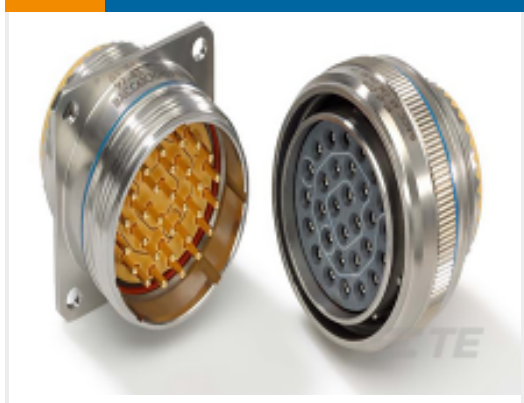
TE 产品编号 ZPF000000000205015 983-0A 20-39 PN-L