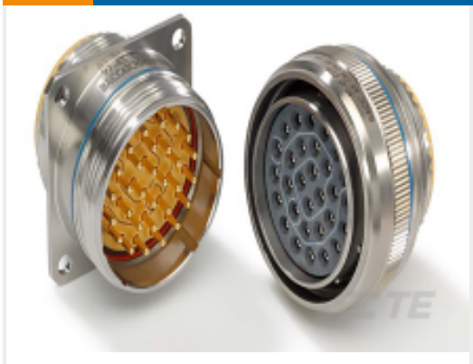
TE 产品编号 ZPF000000000007184 983-ORS 10-06 P6 L