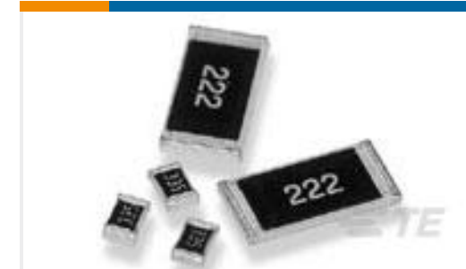
TE 产品编号1623157-1 CRG0805 1% 22K