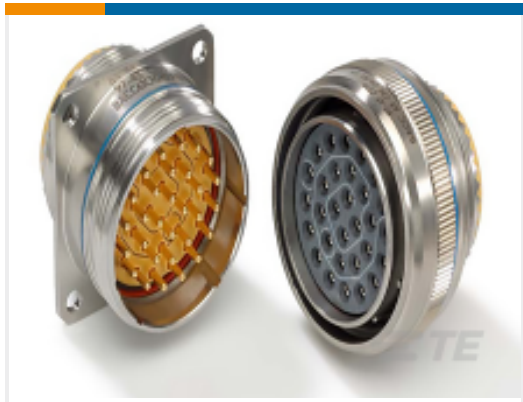
TE 产品编号 ZPF000000000008627 983-6S 16-24 PN-L