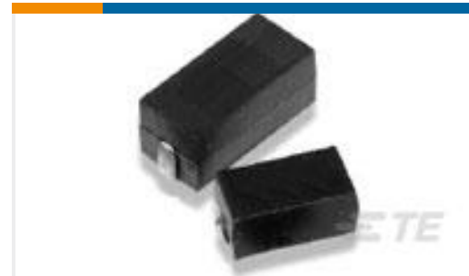
TE 产品编号1879234-1 SMF5 510R 5%