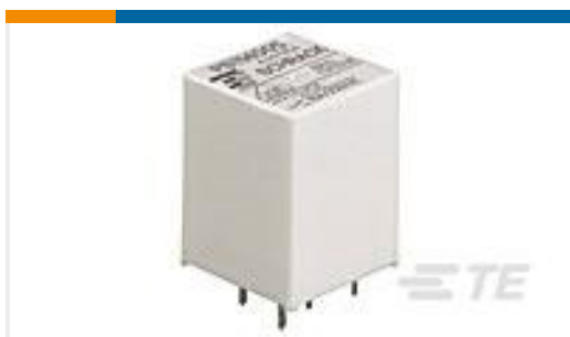
TE 产品编号1415030-1 PB134005