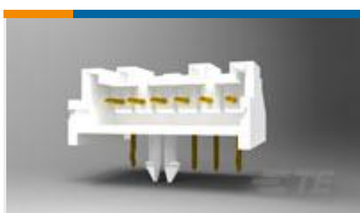
TE 产品编号1744446-4 Hdr Assy, EP 2.5 RA, 4 Pos., GW