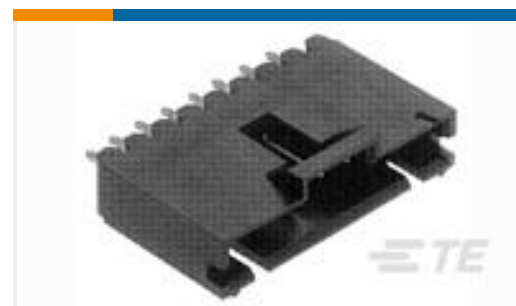
TE 产品编号103670-4 05 MTE HDR SRST LATCH W/HLDWN