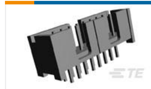
TE 产品编号103308-1 010 LOPRO HDR SP 15DP