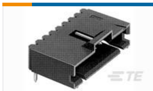
TE 产品编号103634-3 04 MTE HDR SRRA LATCH .100CL