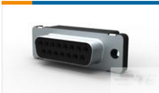
TE 产品编号1658612-3 15 POS HDF RCPT, MS, LEAD FREE