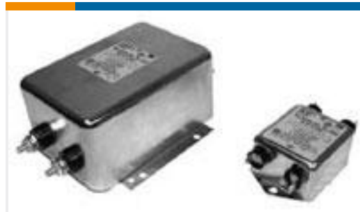
TE 产品编号1-6609037-1 3EMC1=F8126