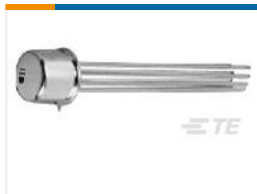
TE 产品编号1617119-5 J1MAW-18XP = M39016/7-021P