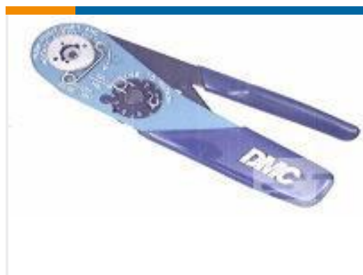
TE 产品编号 601966-1 CRIMPING TOOL M22520/2-01