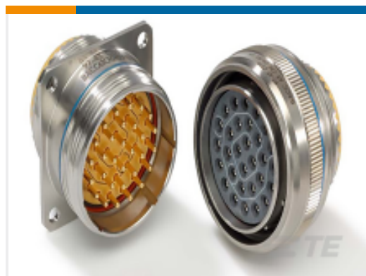
TE 产品编号ZPF000000000007174 983-ORS 08-98 PN