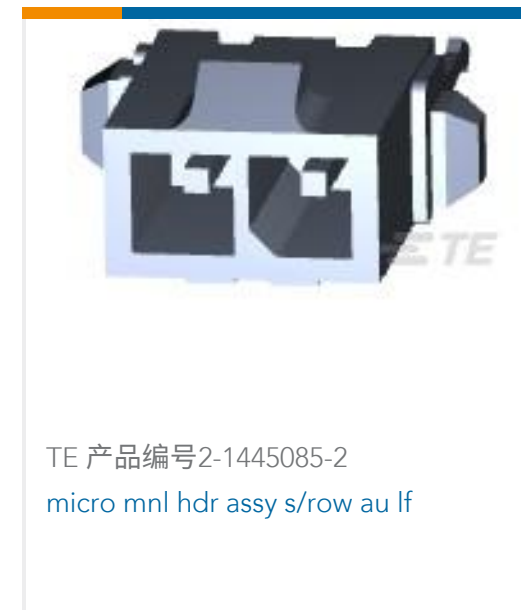
TE 产品编号2-1445085-2 micro mnl hdr assy s/row au lf