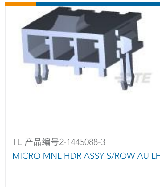
TE 产品编号2-1445088-3 MICRO MNL HDR ASSY S/ROW AU LF