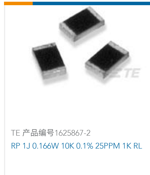
TE 产品编号1625867-2 RP 1J 0.166W 10K 0.1% 25PPM 1K RL