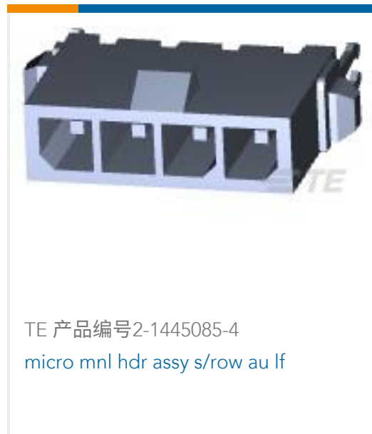
TE 产品编号2-1445085-4 micro mnl hdr assy s/row au lf