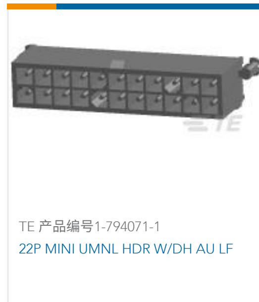
TE 产品编号1-794071-1 22P MINI UMNL HDR W/DH AU LF