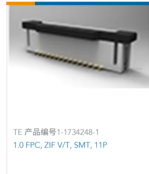
TE 产品编号1-1734248-1 1.0 FPC, ZIF V/T, SMT, 11P