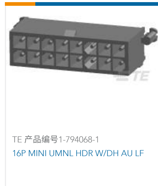
TE 产品编号1-794068-1 16P MINI UMNL HDR W/DH AU LF