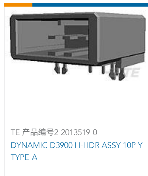
TE 产品编号2-2013519-0 DYNAMIC D3900 H-HDR ASSY 10P Y TYPE-A