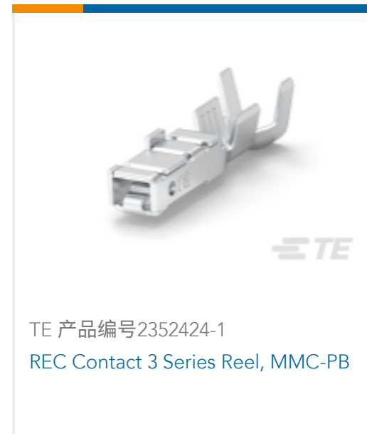
TE 产品编号2352424-1 REC Contact 3 Series Reel, MMC-PB