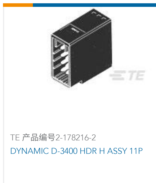
TE 产品编号2-178216-2 DYNAMIC D-3400 HDR H ASSY 11P