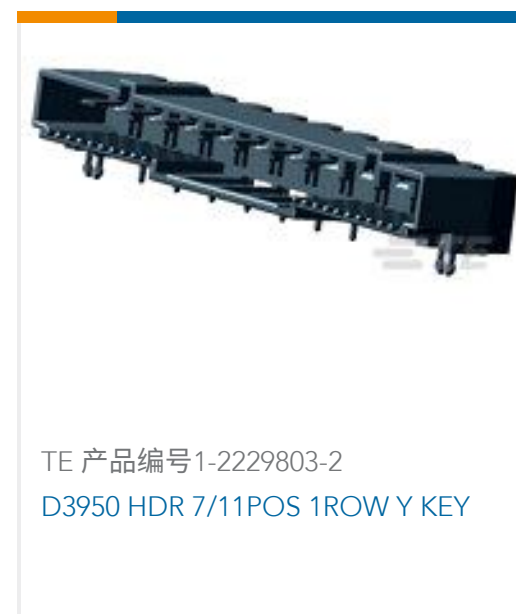
TE 产品编号1-2229803-2 D3950 HDR 7/11POS 1ROW Y KEY TYPE-A