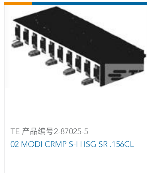
TE 产品编号2-87025-5 02 MODI CRMP S-I HSG SR .156CL