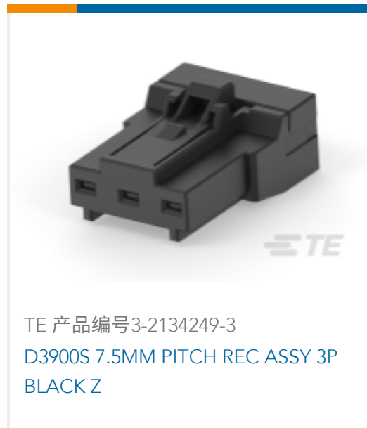
TE 产品编号3-2134249-3 D3900S 7.5MM PITCH REC ASSY 3P BLACK Z