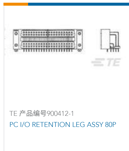
TE 产品编号900412-1 PC I/O RETENTION LEG ASSY 80P