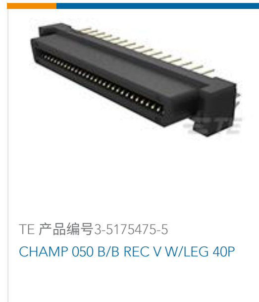
TE 产品编号3-5175475-5 CHAMP 050 B/B REC V W/LEG 40P