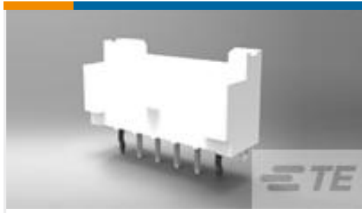
TE 产品编号1-2132415-1 EP2.5 Shrouded HDR ASSY 11P VERT w/oboss