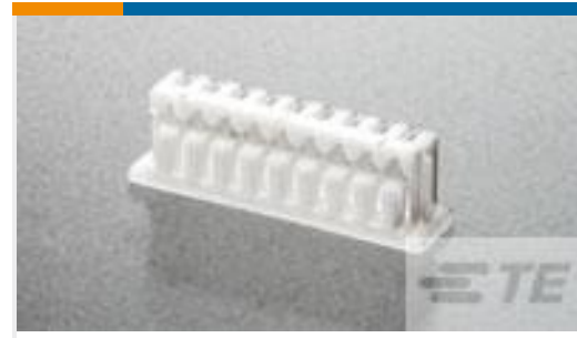
TE 产品编号1-440146-5 1.25mm WTB Socket,Housing,15p