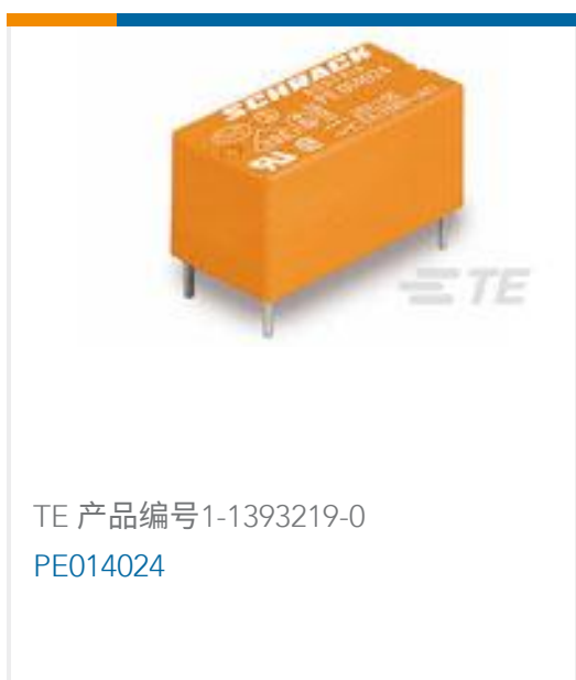
TE 产品编号 1-1393219-0 PE014024