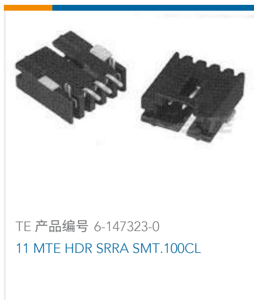
TE 产品编号 6-147323-0 11 MTE HDR SRRA SMT.100CL