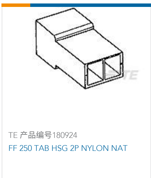
TE 产品编号 180924 FF 250 TAB HSG 2P NYLON NAT