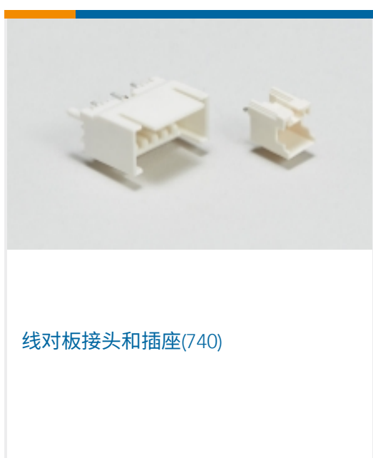
线对板接头和插座(740)