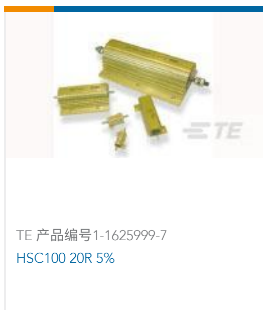
TE 产品编号 1-1625999-7 HSC100 20R 5%