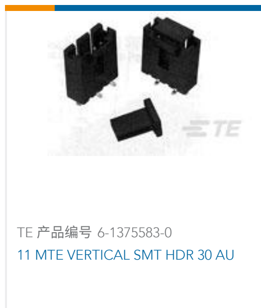
TE 产品编号 6-1375583-0 11 MTE VERTICAL SMT HDR 30 AU