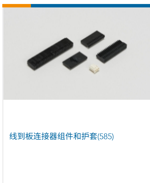
线到板连接器组件和护套(585)