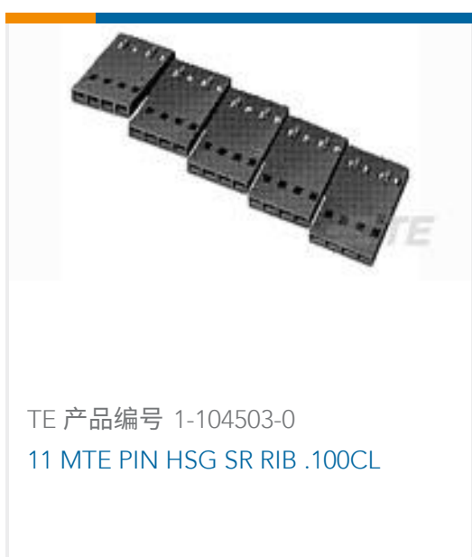
TE 产品编号 1-104503-0 11 MTE PIN HSG SR RIB .100CL