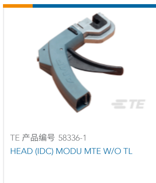
TE 产品编号 58336-1 HEAD (IDC) MODU MTE W/O TL