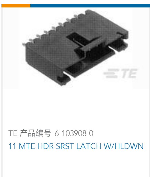
TE 产品编号 6-103908-0 11 MTE HDR SRST LATCH W/HLDWN