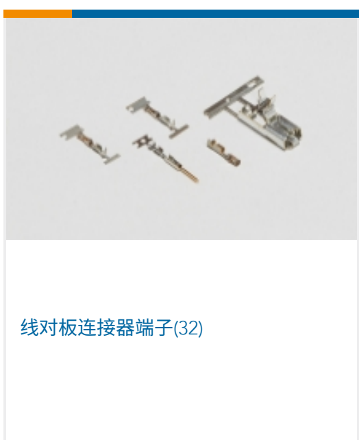
线对板连接器端子(32)