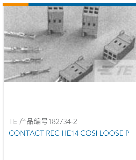
TE 产品编号 182734-2 CONTACT REC HE14 COSI LOOSE P