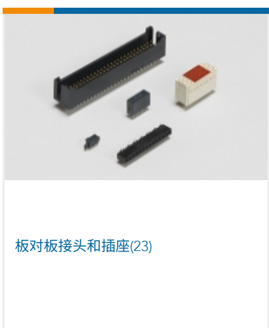
板对板接头和插座(23)