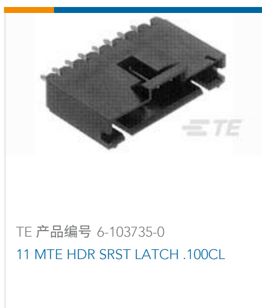
TE 产品编号 6-103735-0 11 MTE HDR SRST LATCH .100CL