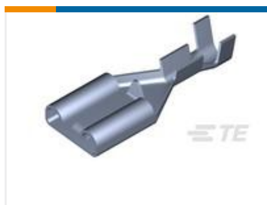
TE 产品编号1217378-3 RAST 5 POSI LOCK MKIII,22-18 A