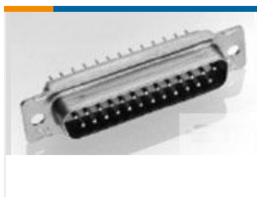
TE 产品编号1757819-2 AMPLIMITE,ASY,PLUG,STD,109,ZN,2