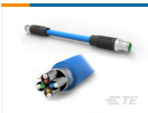
TE 产品编号1-2317142-8 CAT7 光缆 X8 直型-X8 直型