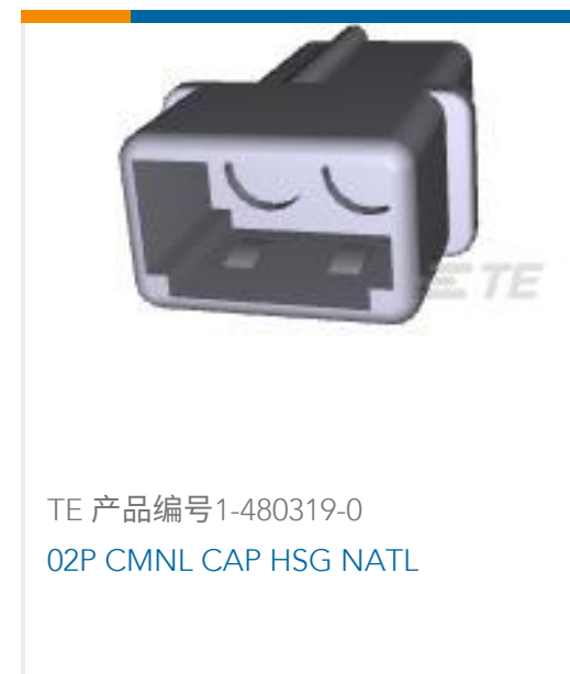
TE 产品编号1-480319-0 02P CMNL CAP HSG NATL