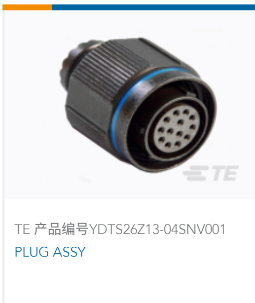
TE 产品编号YDTS26Z13-04SNV001 PLUG ASSY