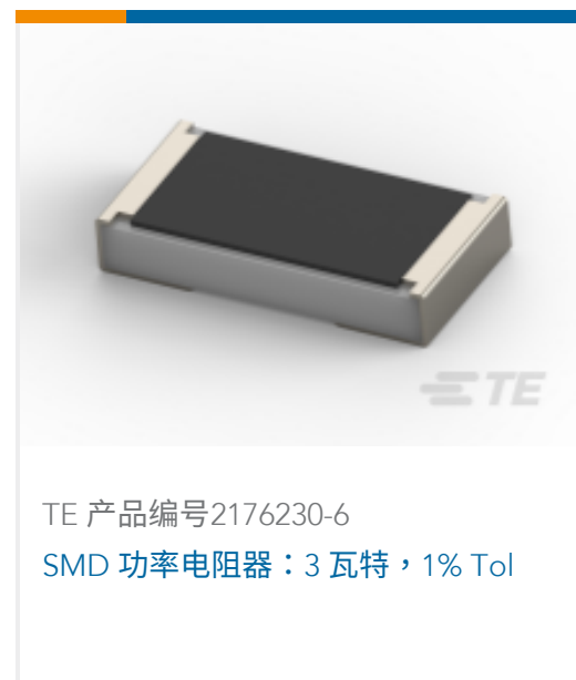
TE 产品编号2176230-6 SMD 功率电阻器：3 瓦特，1% Tol