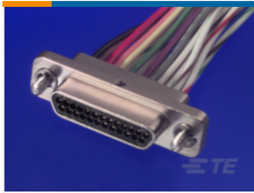
TE 产品编号1532175-7 M83513/04-E11N, MCKS-N1-B- 31S6Q9-18.0