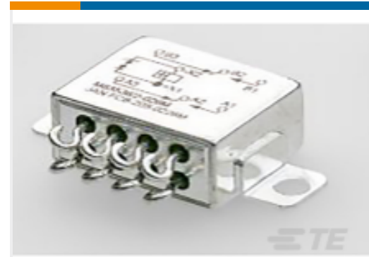
TE 产品编号2-1617758-9 FCB-205-0121M=M83536/1-021M