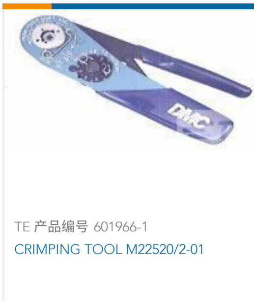
TE 产品编号 601966-1 CRIMPING TOOL M22520/2-01