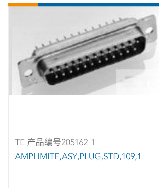
TE 产品编号205162-1 AMPLIMITE,ASY,PLUG,STD,109,1