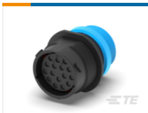
TE 产品编号HDP24-24-16SE-L015 REC, 16P, BLK, E, THD, 12, S