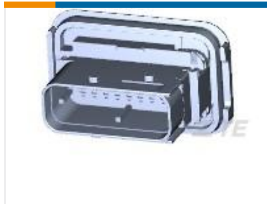
TE 产品编号2-1564532-1 15POS, MIXED,TAB HSG,ASSY