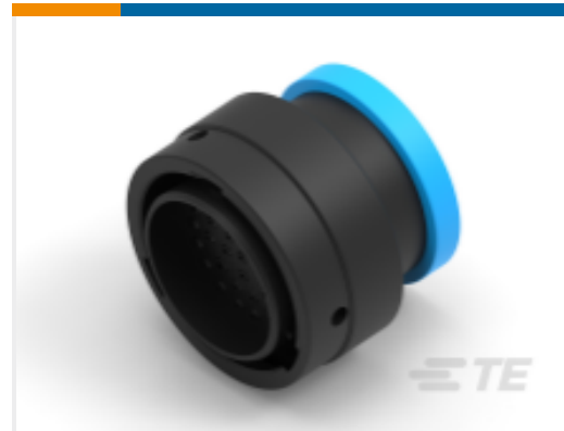
TE 产品编号YHDP26-24-35PEL017 PLG, 35P, BLK, E, RNG, 16/20, P