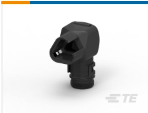
TE 产品编号1011-232-0305 BKSHL, 3P, BLK, PLG, RA, NW6/7.5/8.5 /10