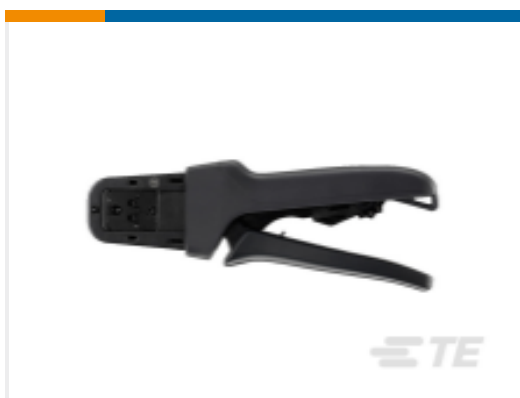
TE 产品编号DTT-20-03 CRIMP TOOL