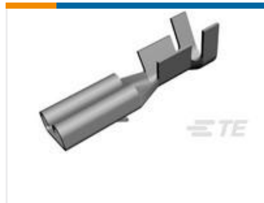
TE 产品编号160668-6 TERMINAL