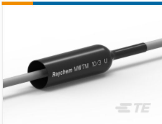
TE 产品编号834936-000 MWTM-10/3-100/S(S100)