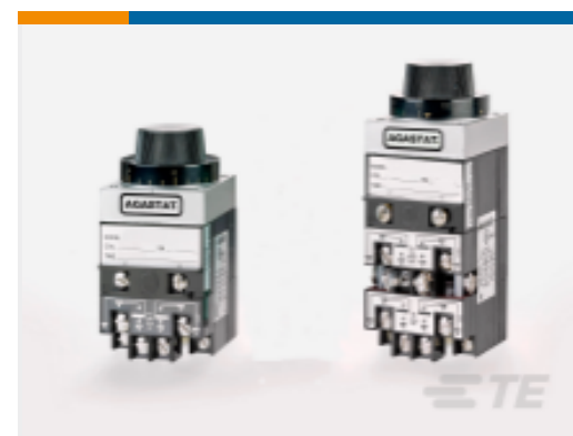
TE 产品编号 1755170-1 7022OCIM=RLY,STD,OFF,2P,24V,15S,I, M