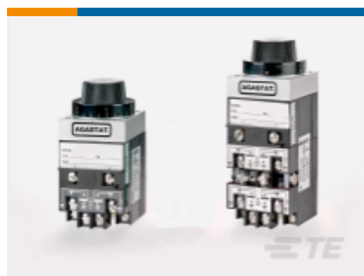
TE 产品编号 3-1423159-3 7012PJ=RLY,STD,ON,2P,125VDC,1