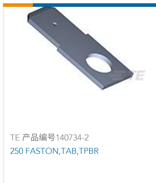
TE 产品编号140734-2 250 FASTON,TAB,TPBR