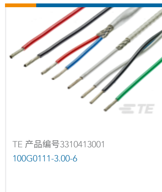
TE 产品编号3310413001 100G0111-3.00-6