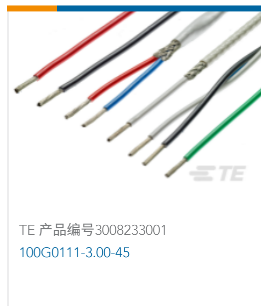
TE 产品编号3008233001 100G0111-3.00-45