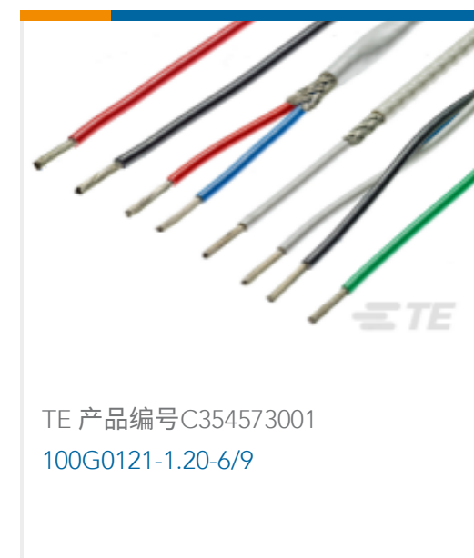
TE 产品编号C354573001 100G0121-1.20-6/9