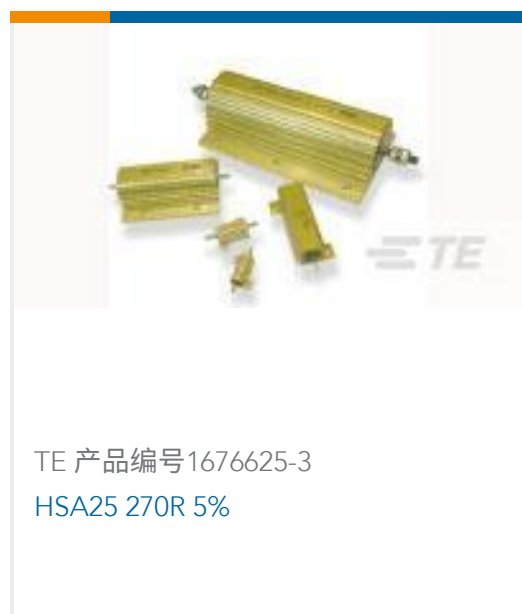
TE 产品编号1676625-3 HSA25 270R 5%