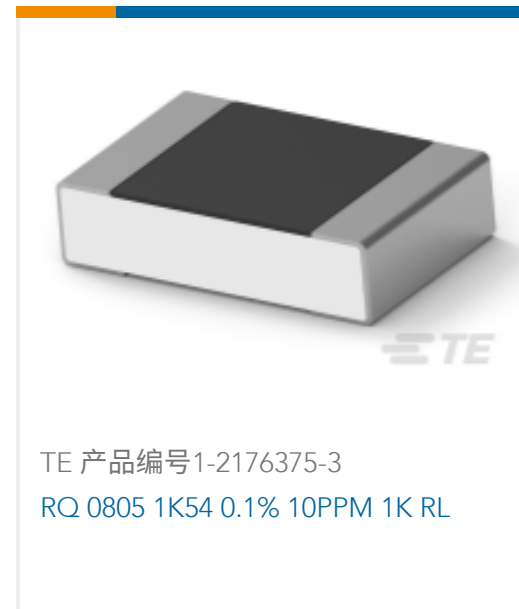
TE 产品编号1-2176375-3 RQ 0805 1K54 0.1% 10PPM 1K RL