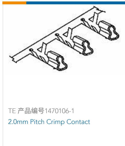
TE 产品编号1470106-1 2.0mm Pitch Crimp Contact