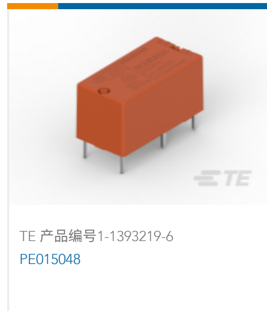
TE 产品编号1-1393219-6 PE015048