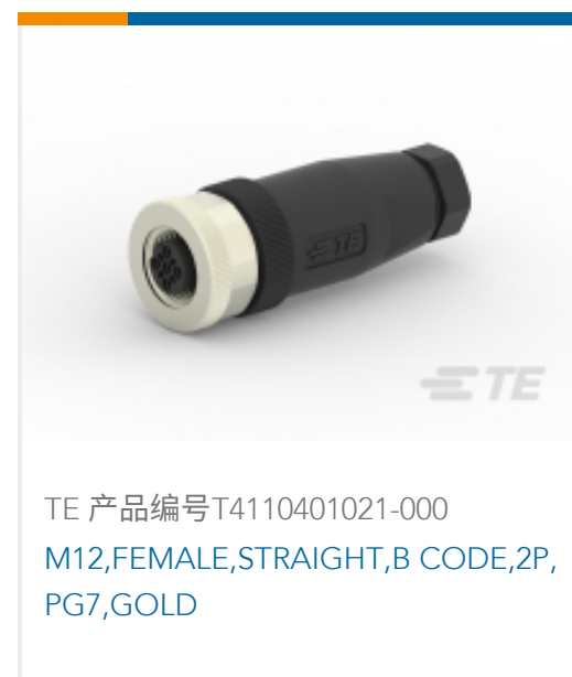
TE 产品编号T4110401021-000 M12,FEMALE,STRAIGHT,B CODE,2P, PG7,GOLD