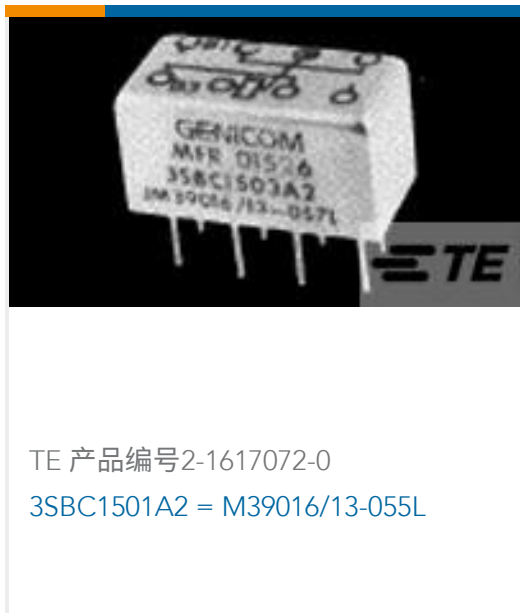
TE 产品编号2-1617072-0 3SBC1501A2 = M39016/13-055L