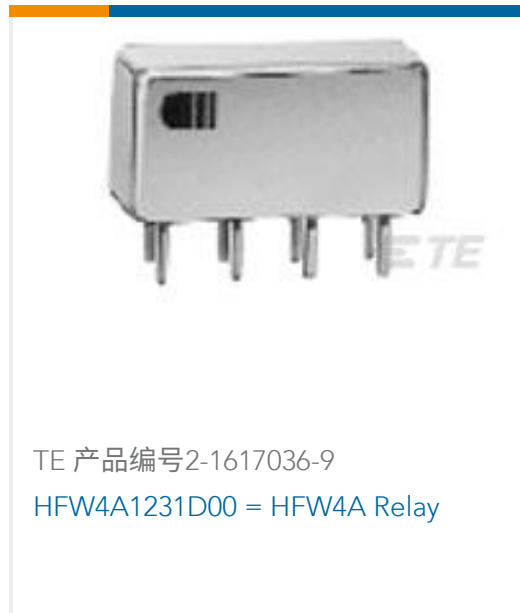
TE 产品编号2-1617036-9 HFW4A1231D00 = HFW4A Relay