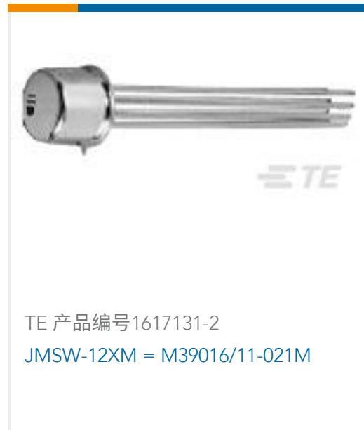
TE 产品编号1617131-2 JMSW-12XM = M39016/11-021M