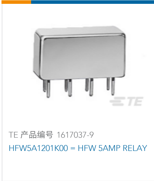
TE 产品编号 1617037-9 HFW5A1201K00 = HFW 5AMP RELAY