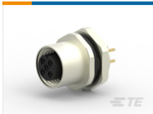
TE 产品编号T4143012041-000 M12,FRONT MOUNTING,FEMALE,A CODE,4P