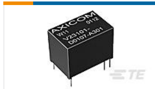
TE 产品编号1-1393779-8 V23101D 7A201