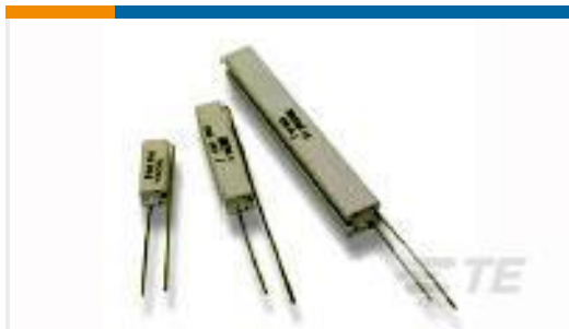
TE 产品编号1-1623728-3 BCHE 11 W 22R 5%