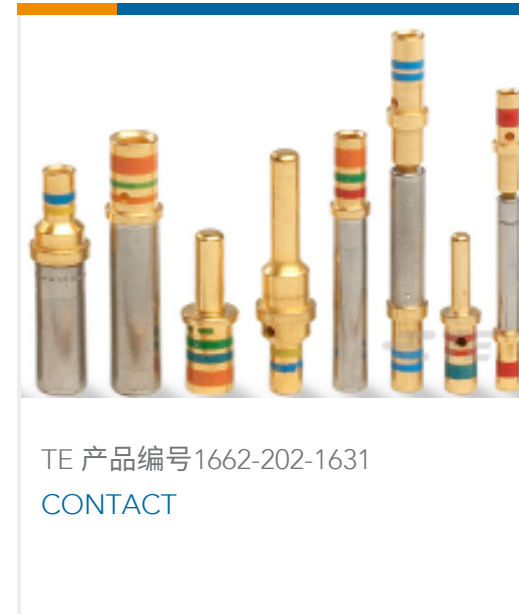
TE 产品编号1662-202-1631 CONTACT