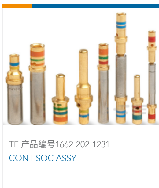
TE 产品编号1662-202-1231 CONT SOC ASSY