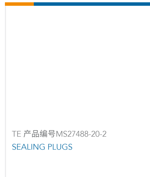
TE 产品编号MS27488-20-2 SEALING PLUGS