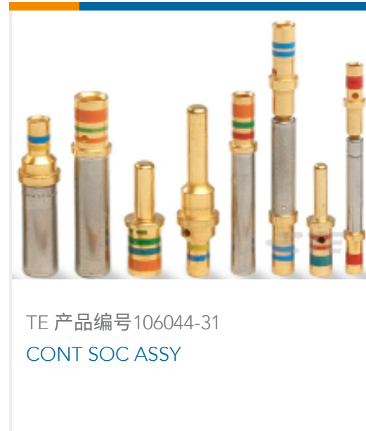
TE 产品编号106044-31 CONT SOC ASSY