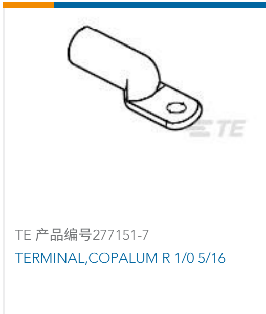
TE 产品编号277151-7 TERMINAL,COPALUM R 1/0 5/16