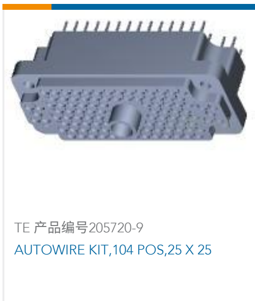
TE 产品编号205720-9 AUTOWIRE KIT,104 POS,25 X 25