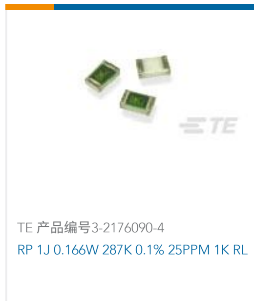
TE 产品编号3-2176090-4 RP 1J 0.166W 287K 0.1% 25PPM 1K RL