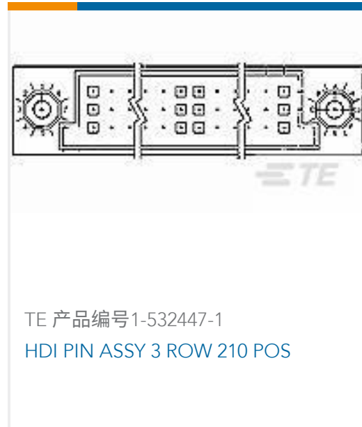
TE 产品编号1-532447-1 HDI PIN ASSY 3 ROW 210 POS