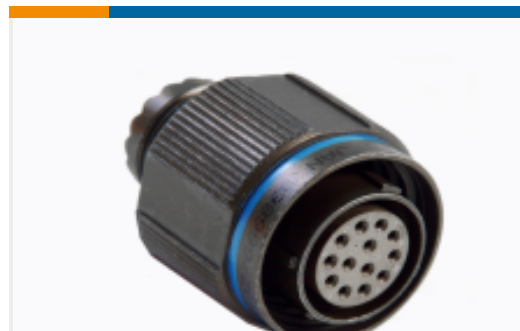
TE 产品编号YDTS26T09-35SAV001 PLUG ASSY