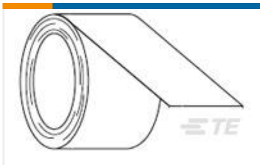
TE 产品编号329190-000 TTP600WE-10