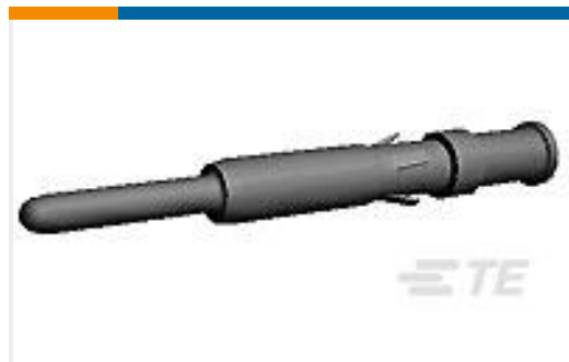
TE 产品编号193844-1 PIN ASSY. 14 AWG