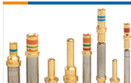
TE 产品编号12336-20 CONT IMP