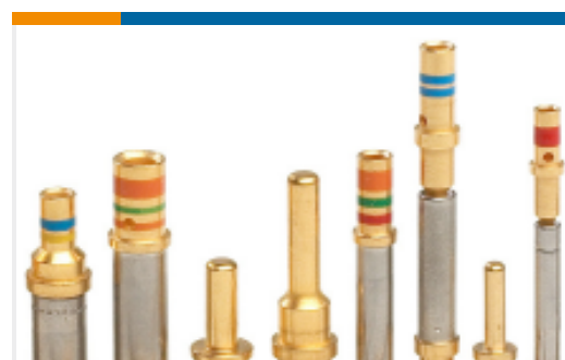
TE 产品编号1662-202-1631 CONTACT