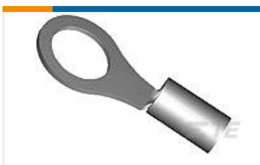
TE 产品编号31398 DG R 22-16 COMM 22-18 MIL 10