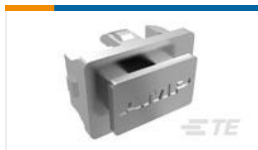
TE 产品编号1367147-1 SFP COVER, UNPLATED