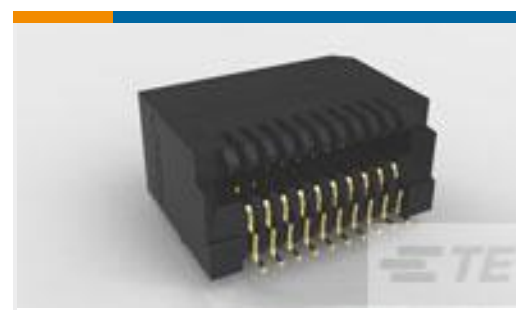
TE 产品编号1367073-2 20 POS SMT CONN, SFP, 30AU