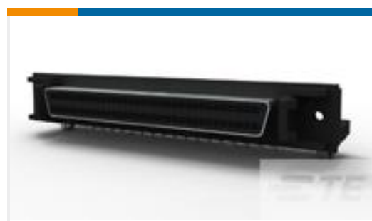
TE 产品编号1761028-4 68 50SR R/A RCPT ASSY, LEAD FREE