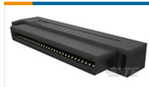
TE 产品编号1734098-6 Champ050 60p A/P RCPT 25CL PB