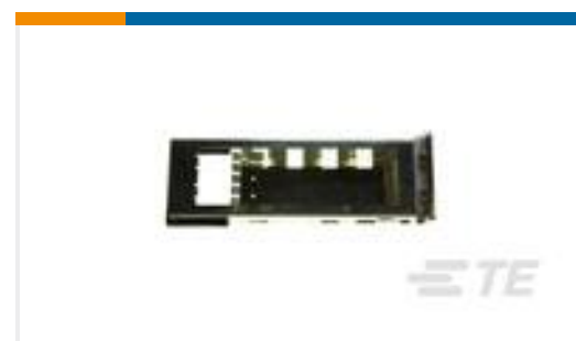
TE 产品编号1489951-1 XFP CAGE ASSEMBLY