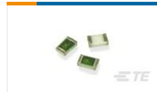
TE 产品编号1676447-5 RN 0805 84K5 0.1% 10PPM CUT LENGTH