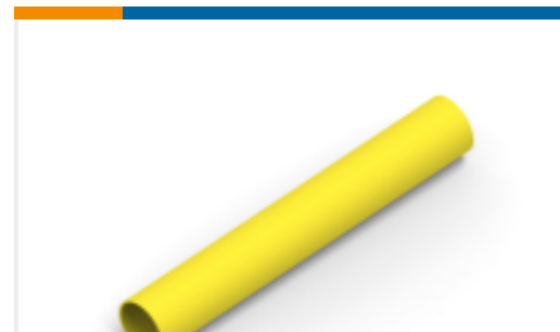
TE 产品编号NB19974001 VERSAFIT-1/16-4-SP