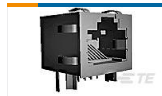
TE 产品编号1-406541-6 MJ, INV, 1X1, 6PNL G., .140" ST, SN