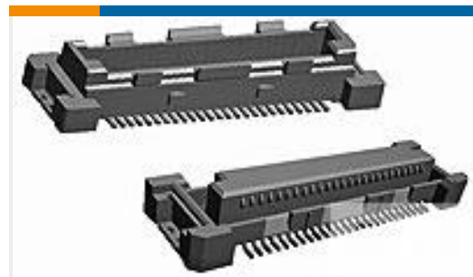
TE 产品编号1-5353190-1 .6FHR04H, 160, S, GIG, 08/Sn, TR, NSNo