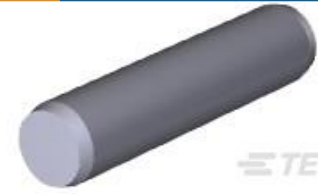
TE 产品编号201501-1 SPIROL PIN