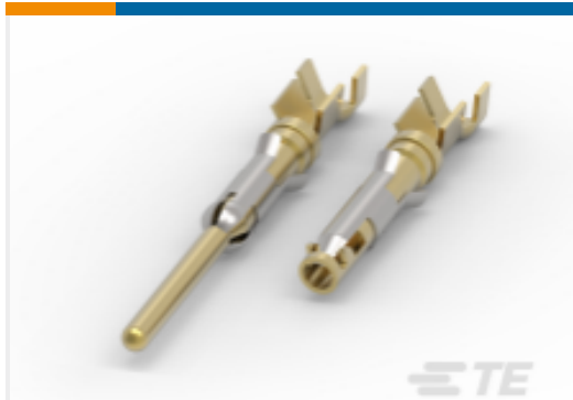
TE 产品编号164164-1 欧洲、中东和非洲类型 III 端子低型面