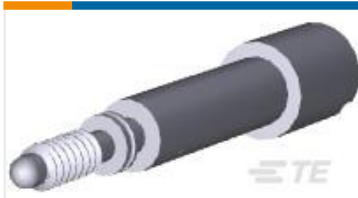
TE 产品编号 201087-1 SERIES "M" JACKSCREW - MALE AS