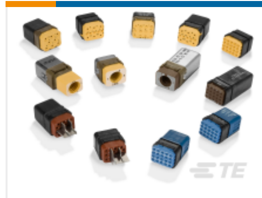
TE 产品编号ZPF000000000163975 DMC-M 99-04 CN (=33537-PC000)