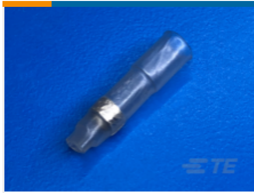
TE 产品编号F78598-000 B-155-1504