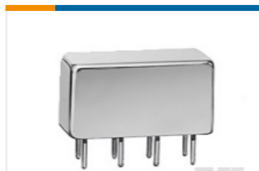
TE 产品编号2-1617029-0 HFW1130L01M = M39016/6-132M