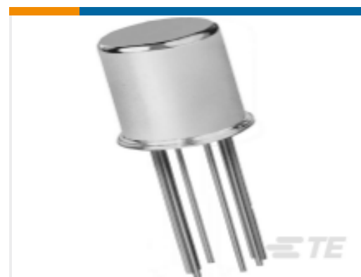
TE 产品编号1617123-8 JMAP-5XM = M39016/9-019M