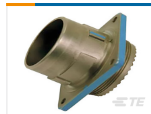
TE 产品编号YDIV46E11-35PCC009 PLUG ASSY