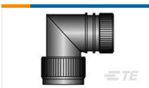
TE 产品编号583543-000 HEX40-AB-90-23-A10-1