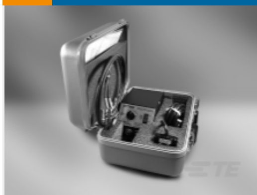
TE 产品编号 173643-000 RH-3960-1-TINEL-KIT-120V