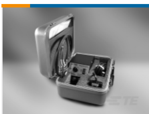
TE 产品编号 173643-000 RH-3960-1-TINEL-KIT-120V