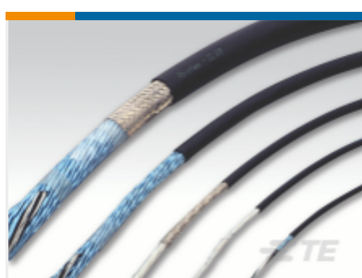
TE 产品编号CT14133001 CL105-7X2X0.50-PIO-OCK5500