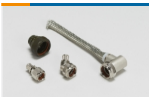
加固型后盖和适配器(2821)