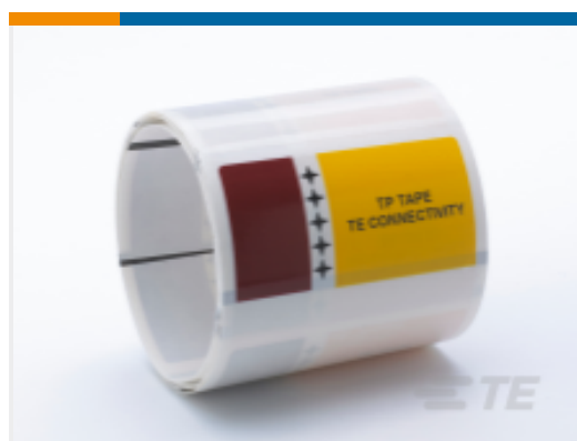
TE 产品编号905962-000 TP 胶带色码聚酯标签