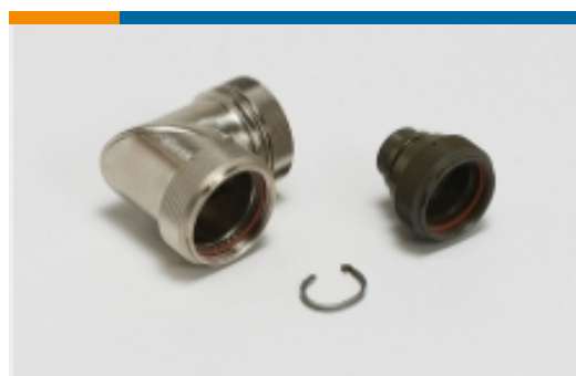
屏蔽后壳和适配器(1)