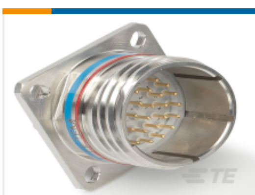
TE 产品编号YACT20JD35JNV00100 SQUARE FLANGE RECEPTACLE