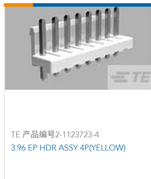
TE 产品编号2-1123723-4 3.96 EP HDR ASSY 4P(YELLOW)