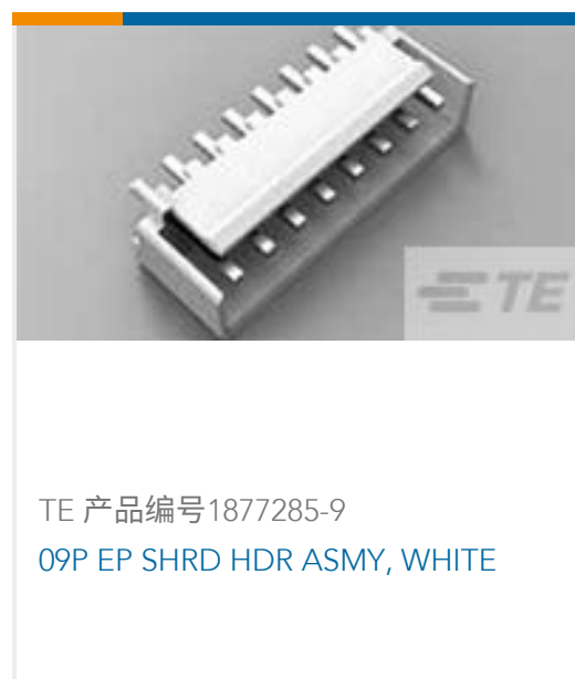
TE 产品编号1877285-9 09P EP SHRD HDR ASMY, WHITE