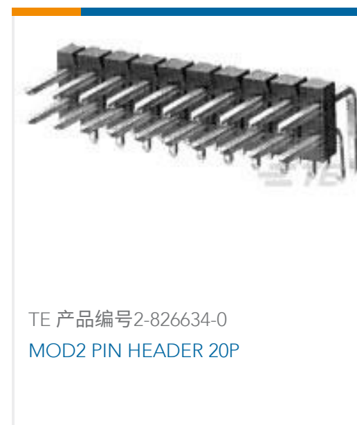
TE 产品编号2-826634-0 MOD2 PIN HEADER 20P