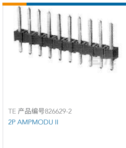
TE 产品编号826629-2 2P AMPMODU II