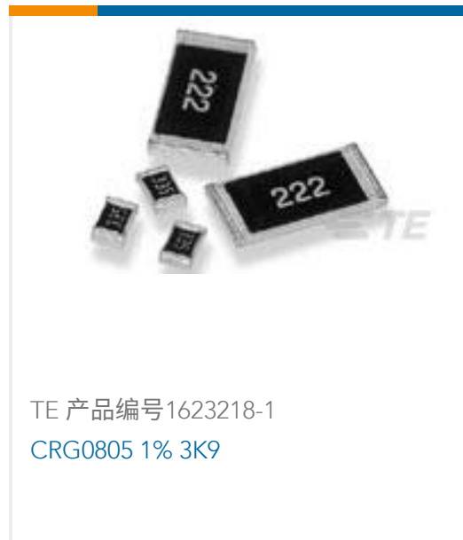
TE 产品编号1623218-1 CRG0805 1% 3K9