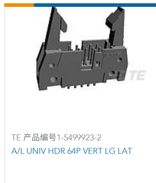
TE 产品编号1-5499923-2 A/L UNIV HDR 64P VERT LG LAT