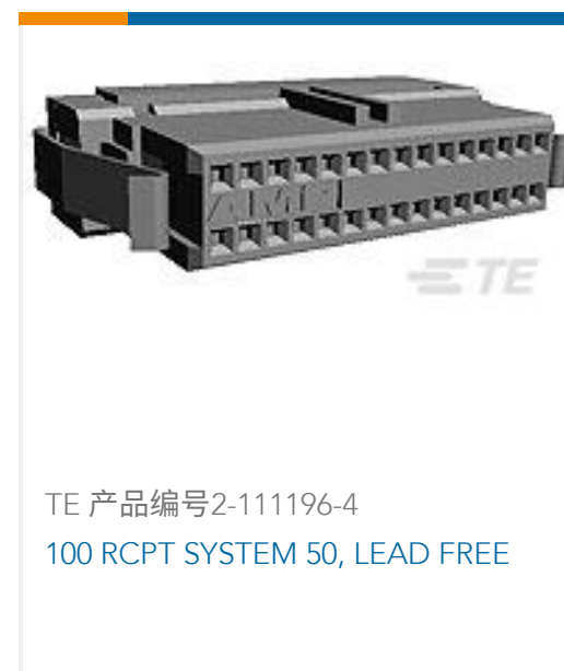
TE 产品编号2-111196-4 100 RCPT SYSTEM 50, LEAD FREE