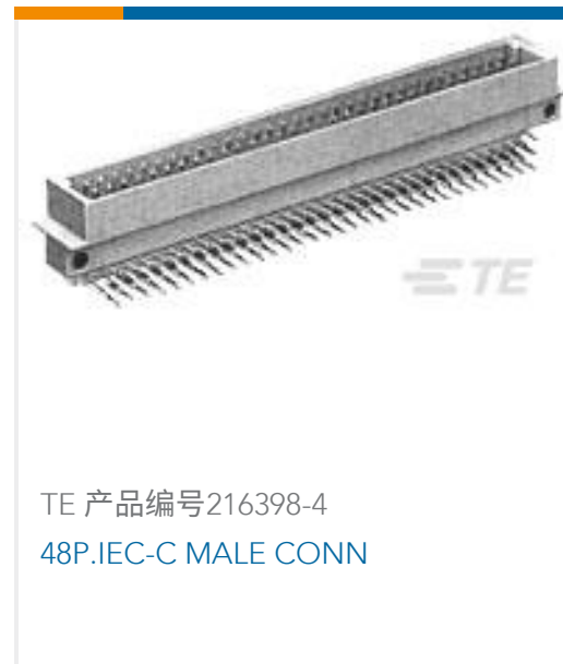
TE 产品编号216398-4 48P.IEC-C MALE CONN