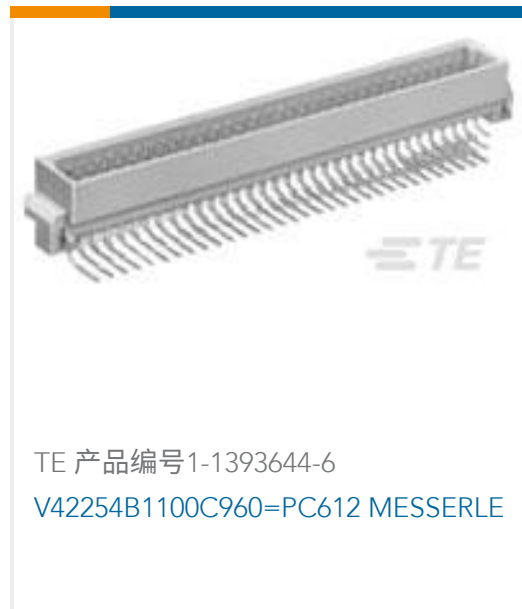
TE 产品编号1-1393644-6 V42254B1100C960=PC612 MESSERLE