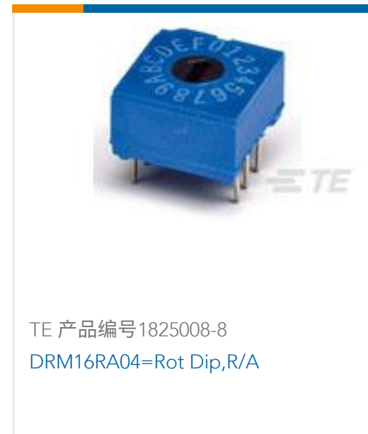
TE 产品编号1825008-8 DRM16RA04=Rot Dip,R/A