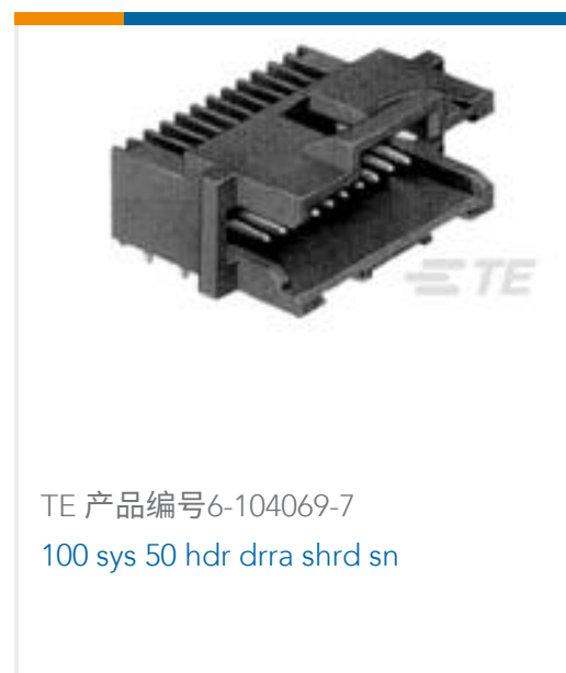
TE 产品编号6-104069-7 100 sys 50 hdr drra shrd sn