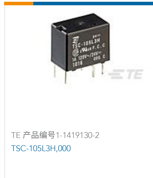
TE 产品编号1-1419130-2 TSC-105L3H,000