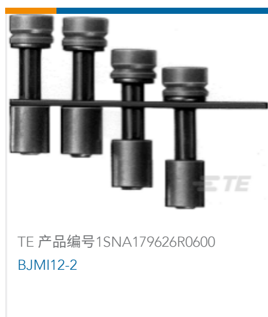
TE 产品编号1SNA179626R0600 BJMI12-2