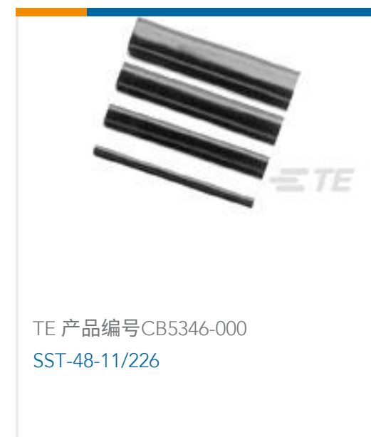
TE 产品编号CB5346-000 SST-48-11/226