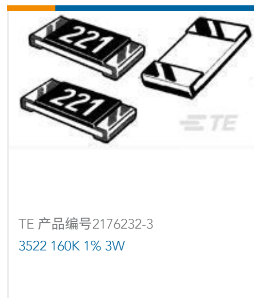
TE 产品编号2176232-3 3522 160K 1% 3W