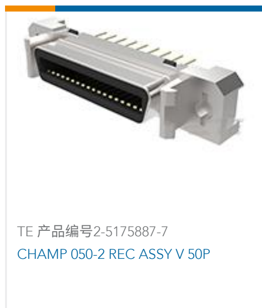
TE 产品编号2-5175887-7 CHAMP 050-2 REC ASSY V 50P