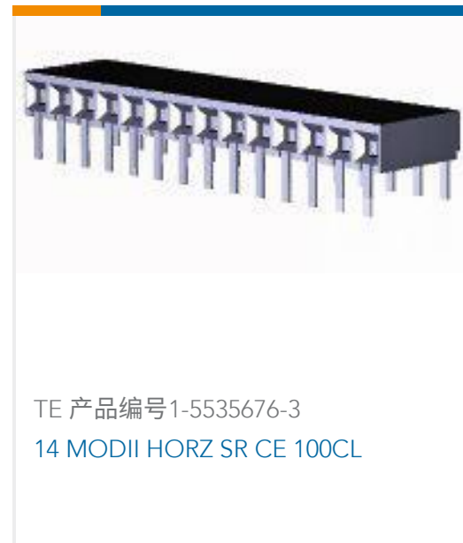
TE 产品编号1-5535676-3 14 MODII HORZ SR CE 100CL