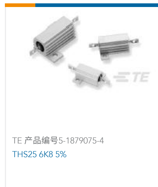
TE 产品编号5-1879075-4 THS25 6K8 5%