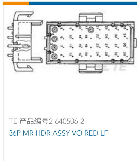
TE 产品编号2-640506-2 36P MR HDR ASSY VO RED LF