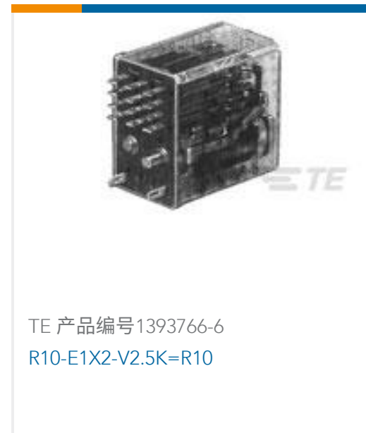
TE 产品编号1393766-6 R10-E1X2-V2.5K=R10