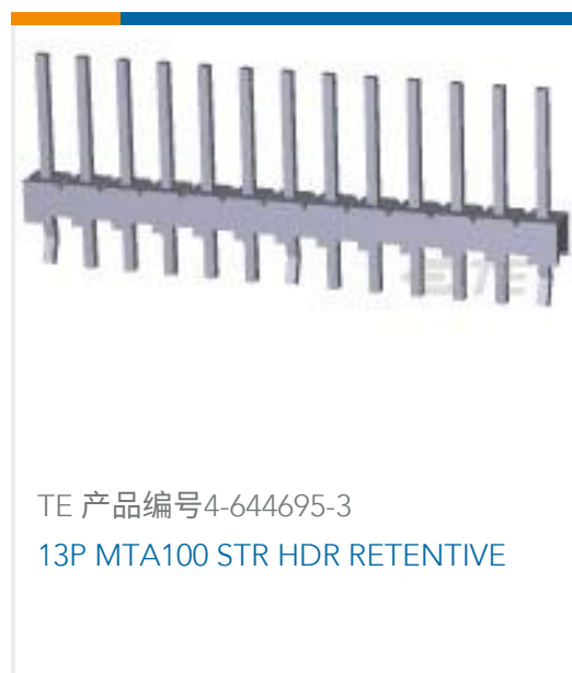
TE 产品编号4-644695-3 13P MTA100 STR HDR RETENTIVE