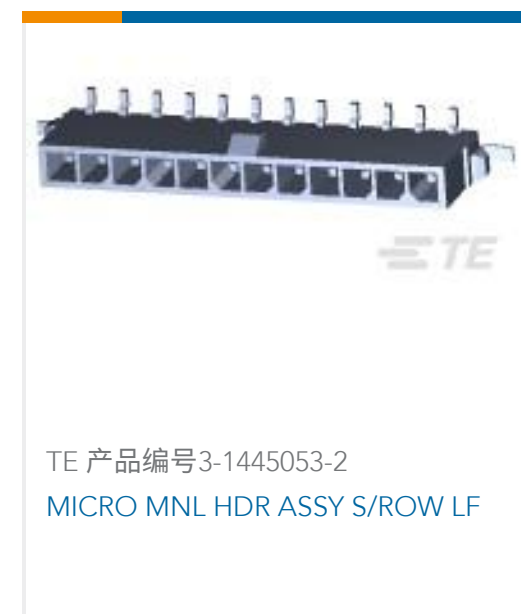
TE 产品编号3-1445053-2 MICRO MNL HDR ASSY S/ROW LF