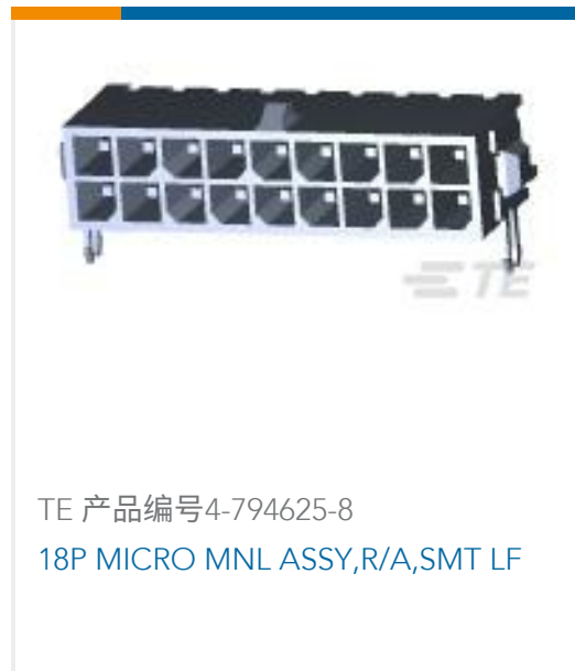
TE 产品编号4-794625-8 18P MICRO MNL ASSY,R/A,SMT LF