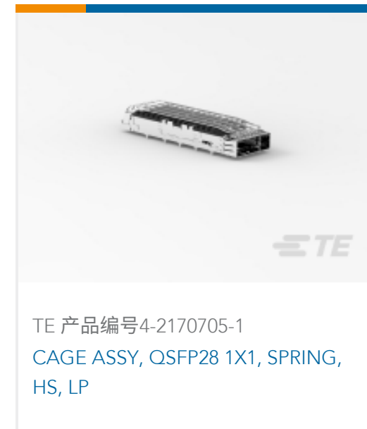
TE 产品编号4-2170705-1 CAGE ASSY, QSFP28 1X1, SPRING, HS, LP