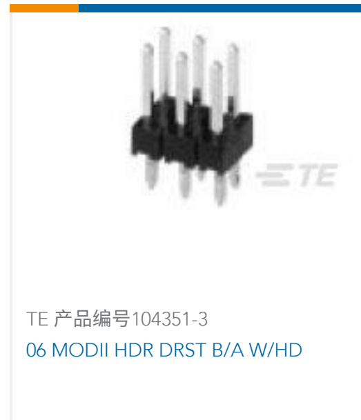
TE 产品编号104351-3 06 MODII HDR DRST B/A W/HD