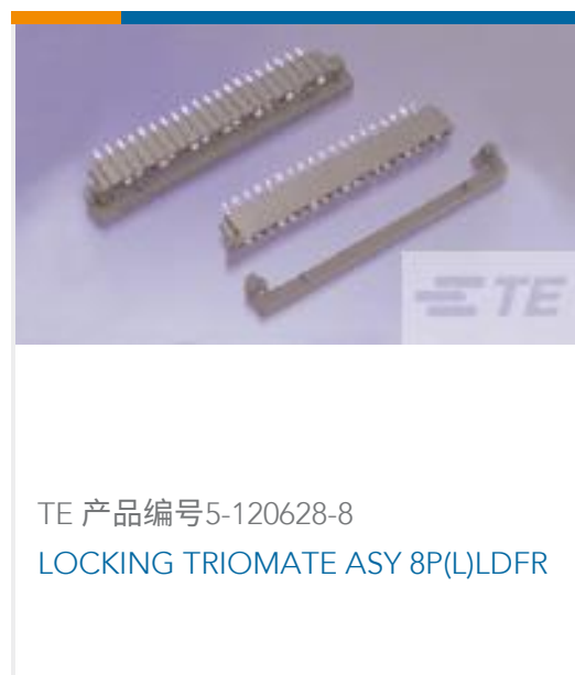
TE 产品编号5-120628-8 LOCKING TRIOMATE ASY 8P(L)LDFR