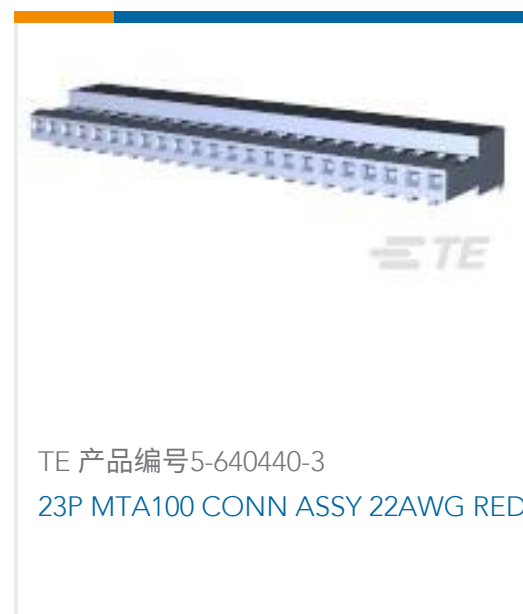
TE 产品编号5-640440-3 23P MTA100 CONN ASSY 22AWG RED