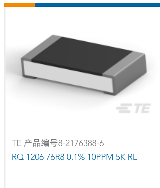
TE 产品编号8-2176388-6 RQ 1206 76R8 0.1% 10PPM 5K RL