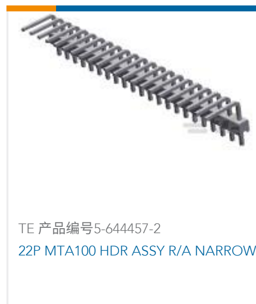
TE 产品编号5-644457-2 22P MTA100 HDR ASSY R/A NARROW