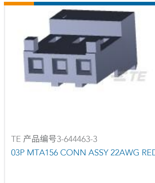
TE 产品编号3-644463-3 03P MTA156 CONN ASSY 22AWG RED