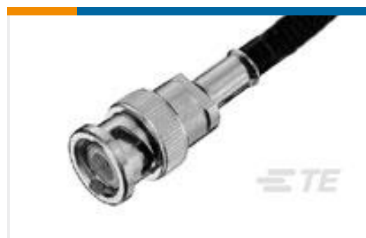
TE 产品编号2-329444-1 BNC PLUG KIT