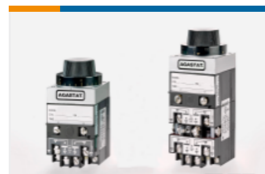
TE 产品编号5-1423162-8 7022ACM=RLY,STD,OFF,2P,120VAC,3