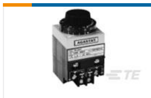
TE 产品编号1-1423162-2 7022AH=RLY,STD,OFF,2P,120VAC,3