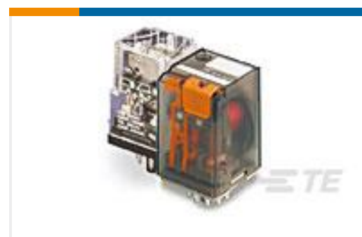
TE 产品编号6-1393104-4 KRPA-14AG-12=KRPA