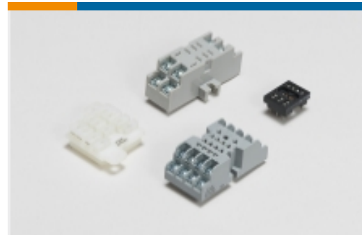
继电器附件、插座和卡箍(5)