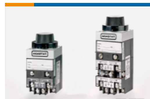
TE 产品编号1423159-2 7012NB=RLY,STD,ON,2P,48VDC,5 S