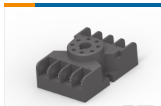
TE 产品编号1393143-6 27E122=SOCKET,KRP,8,SCW,PLES