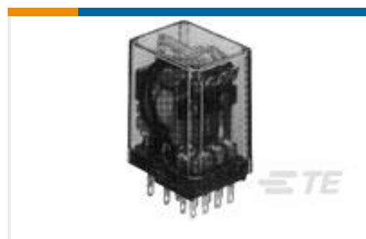
TE 产品编号3-1393123-9 KHU-17D11-110=KH