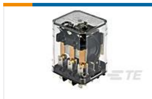
TE 产品编号8-1393117-3 KUP-14A25-120=KU