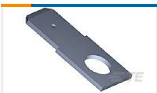
TE 产品编号1742375-1 TAB,FASON,.375 SERIES