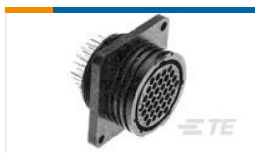
TE 产品编号1986377-1 CPC PSTD RCPT,13-7, rev sex