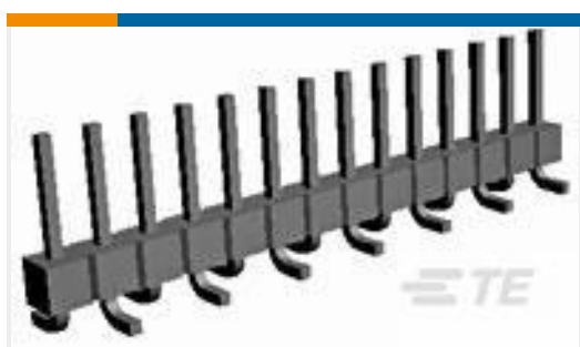
TE 产品编号147118-1 03 MODII HDR SR SFMNT B/A .100