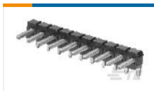
TE 产品编号102978-2 02 MODII HDR SRRA B/A .100CL