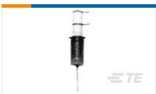
TE 产品编号1-1618240-4 K43B732=RELAY, VACUUM, SPST-NC