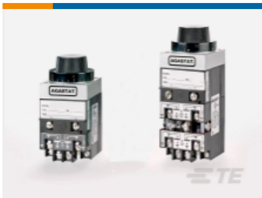
TE 产品编号6-1423159-4 7012X3C=RLY,STD,ON,2P,110VDC,1