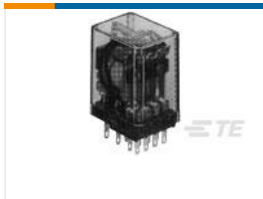
TE 产品编号2-1393123-7 KHU-17A11H-120=KH