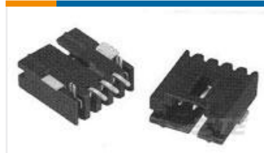
TE 产品编号5-147323-5 06 MTE HDR SRRA SMT.100CL