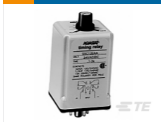
TE 产品编号5-1437472-8 SSC32ACA="RLY,INTV,2P,120VAC"