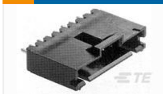
TE 产品编号104362-7 08 MTE HDR SRST LATCH W/HLDWN