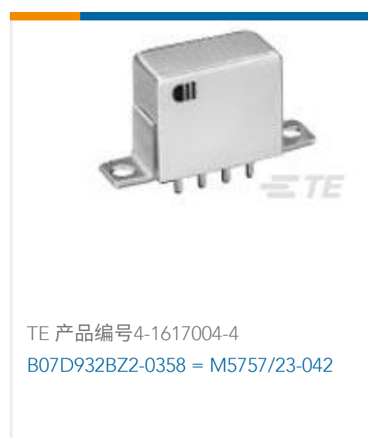
TE 产品编号4-1617004-4 B07D932BZ2-0358 = M5757/23-042