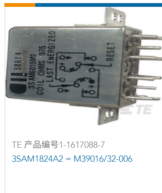
TE 产品编号1-1617088-7 3SAM1824A2 = M39016/32-006