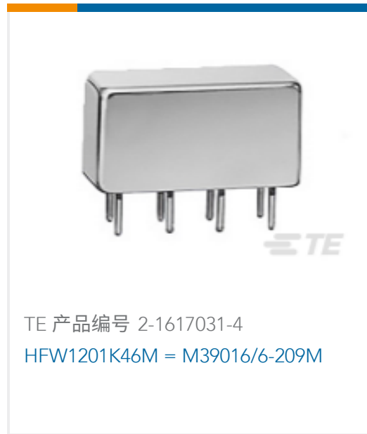
TE 产品编号 2-1617031-4 HFW1201K46M = M39016/6-209M