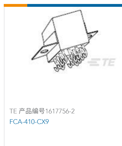
TE 产品编号1617756-2 FCA-410-CX9