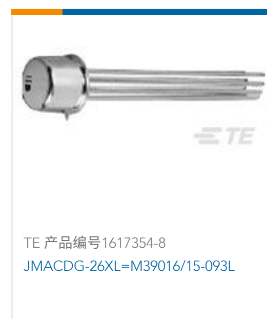
TE 产品编号1617354-8 JMACDG-26XL=M39016/15-093L