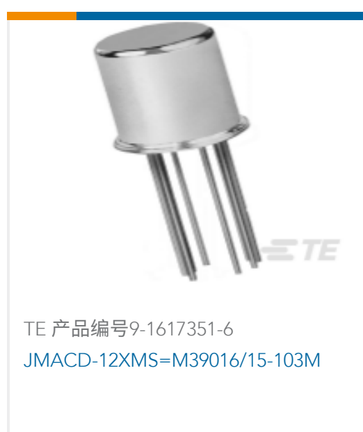
TE 产品编号9-1617351-6 JMACD-12XMS=M39016/15-103M