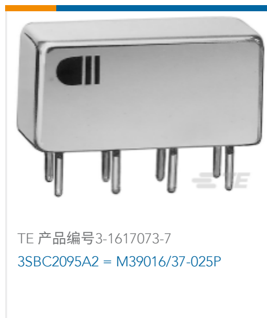
TE 产品编号3-1617073-7 3SBC2095A2 = M39016/37-025P