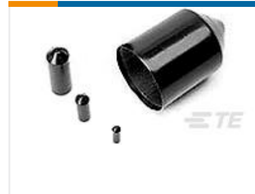
TE 产品编号 843408-000 101A041-4-0