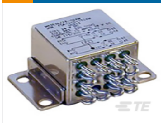
TE 产品编号 3-1617805-1 TD229-3002S=TDFR 30 SEC