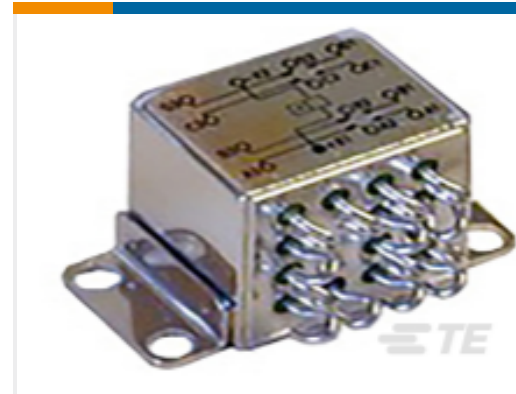
TE 产品编号 1-1617787-0 FCB-405-0520L=M83536/5-020L