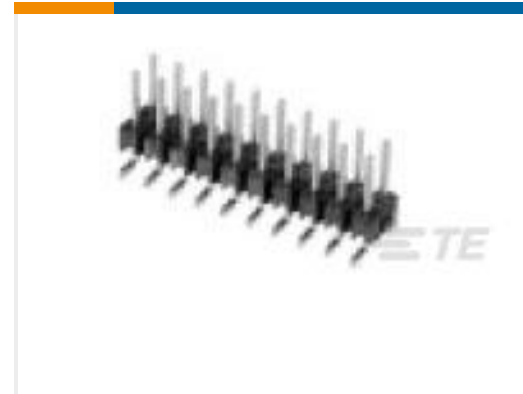
TE 产品编号 147279-4 04 MODII HDR DR SFMT B/A T&R