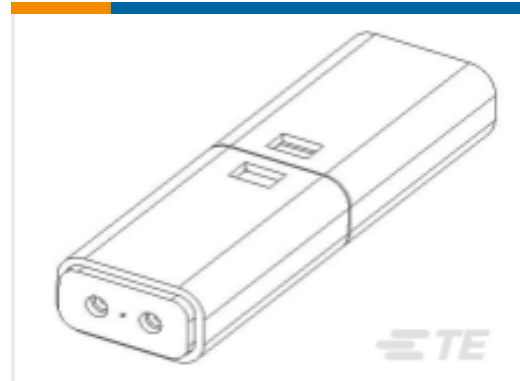
TE 产品编号65053-234 ELEC MODULE