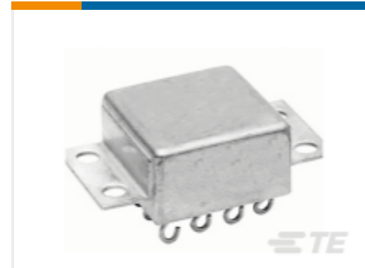
TE 产品编号8-1617349-0 3SBM1089A2=M39016/36-006M