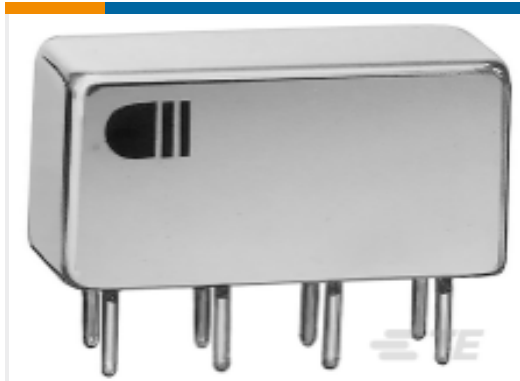
TE 产品编号3-1617515-0 3SBC1793A2=M39016/13-101M