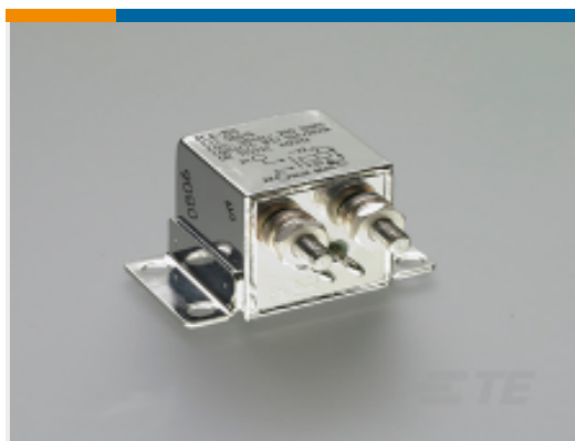
TE 产品编号5-1617800-8 FCAC-150-KY4=50 AMP MID RANGE RELAY