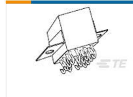
TE 产品编号1617756-7 FCA-410-CY9