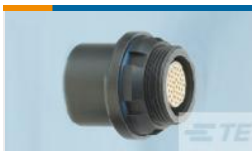
TE 产品编号2101553-1 PLUG,7 POS,CIRCULAR HD,PCB-POL2