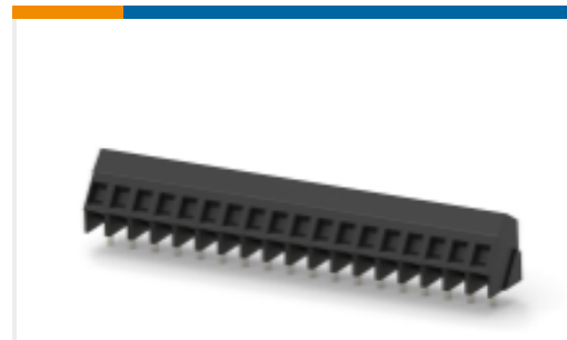
TE 产品编号1-796689-8 TERMI-BLOK PCB MOUNT 35 18P.