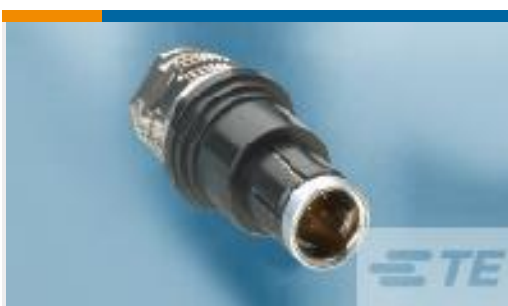
TE 产品编号2101550-1 PLUG,7 POS,Sz103,w/SOLDER CUPS, 140 POT