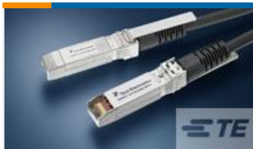
TE 产品编号2032757-2 C/A, ACTIVE SFP+ TO SFP+, TI 1M 30AWG