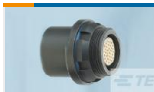
TE 产品编号2101553-2 PLUG,7 POS,CIRCULAR HD,PCB,POL1