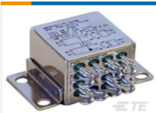
TE 产品编号9-1617804-8 TD230C-6002SX=TDAO 6 TO 60 SEC