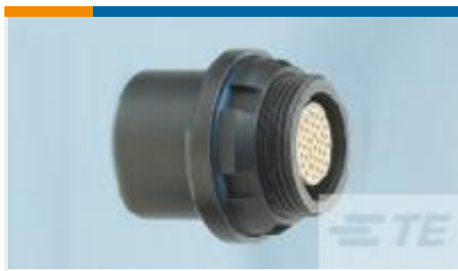
TE 产品编号 2101553-1 PLUG,7 POS,CIRCULAR HD,PCB-POL2