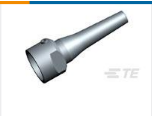
TE 产品编号1918933-4 Std Cbl Adp w Boot, HA 5.5