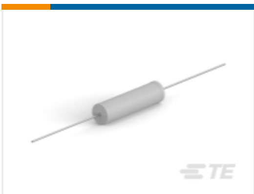
TE 产品编号2-2176414-7 7W STD M/OX 5% 240R