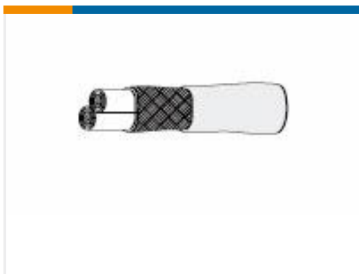
TE 产品编号575395-000 55A1812-12-9-9CS2275