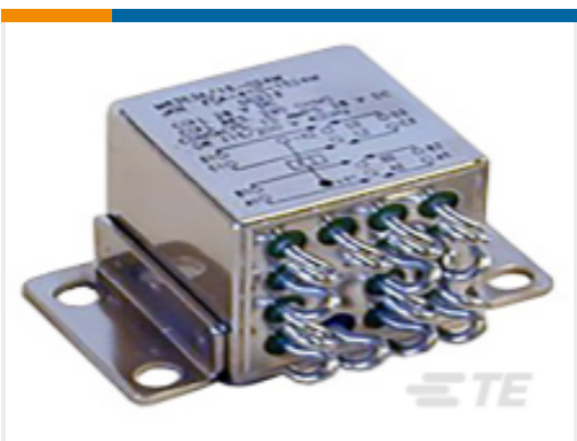
TE 产品编号2-1617805-8 TD229-1001P=TDFR 1 SEC M83726/29-1001P