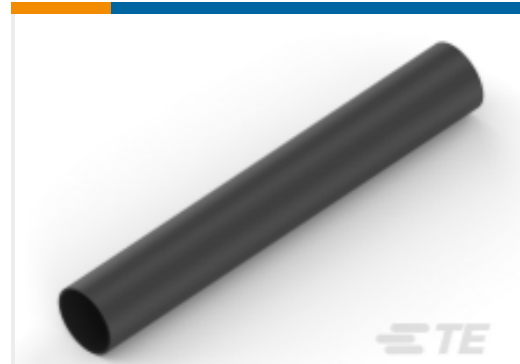
TE 产品编号8168092003 TPEM-NR11-0-STK