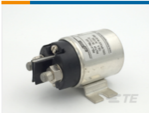
TE 产品编号K1060028 Relay 29-111-12