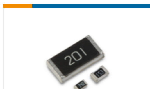
TE 产品编号1-2176325-1 CRGP 0402 68R 1%