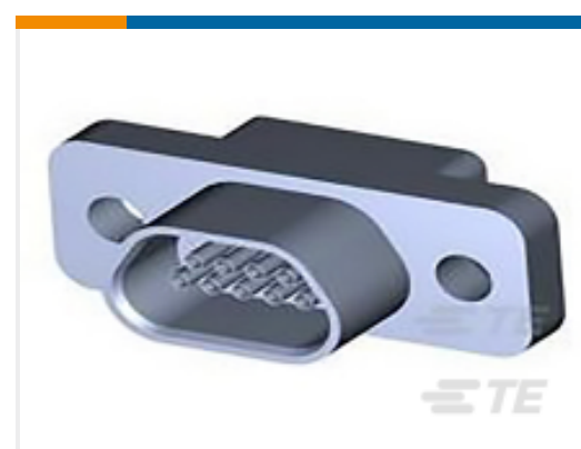
TE 产品编号1532211-1 M83513/01-CN, MCKS-N1-B-21PS