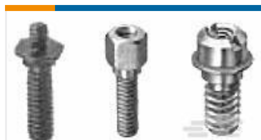
TE 产品编号750831-1 .050SR FEM SCRLCK KIT,SLIM LN