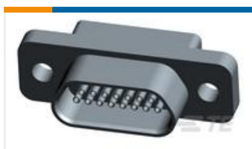
TE 产品编号1532188-1 M83513/02-BN, MCKS-N1-B-15SS