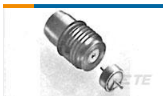
TE 产品编号1059637-1 4557 5329 02