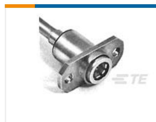
TE 产品编号1059868-1 4706 7985 02