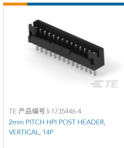
TE 产品编号3-1735446-4 2mm PITCH HPI POST HEADER, VERTICAL, 14P