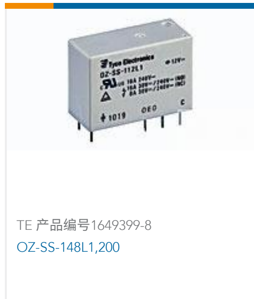
TE 产品编号1649399-8 OZ-SS-148L1,200