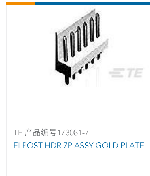
TE 产品编号173081-7 EI POST HDR 7P ASSY GOLD PLATE