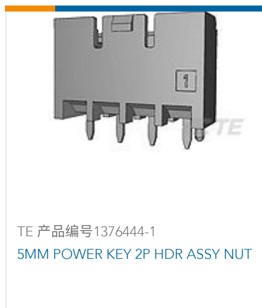
TE 产品编号1376444-1 5MM POWER KEY 2P HDR ASSY NUT