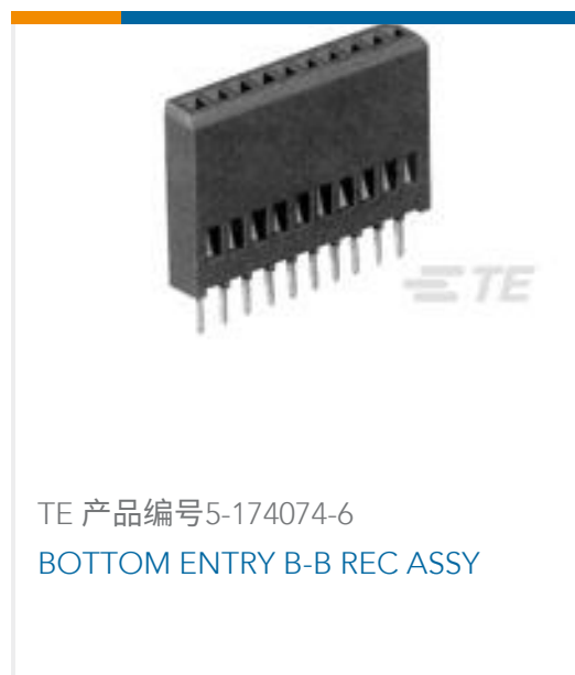
TE 产品编号5-174074-6 BOTTOM ENTRY B-B REC ASSY