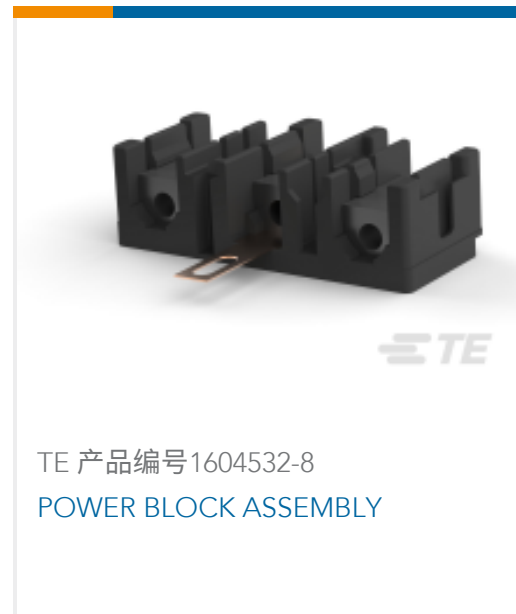
TE 产品编号1604532-8 POWER BLOCK ASSEMBLY