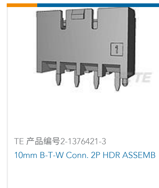
TE 产品编号2-1376421-3 10mm B-T-W Conn. 2P HDR ASSEMB