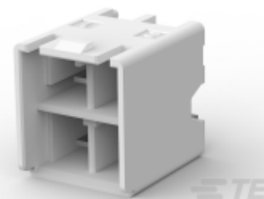
TE 产品编号 1376386-2 5mm B-T-W Conn. 4P(2row) HDR A