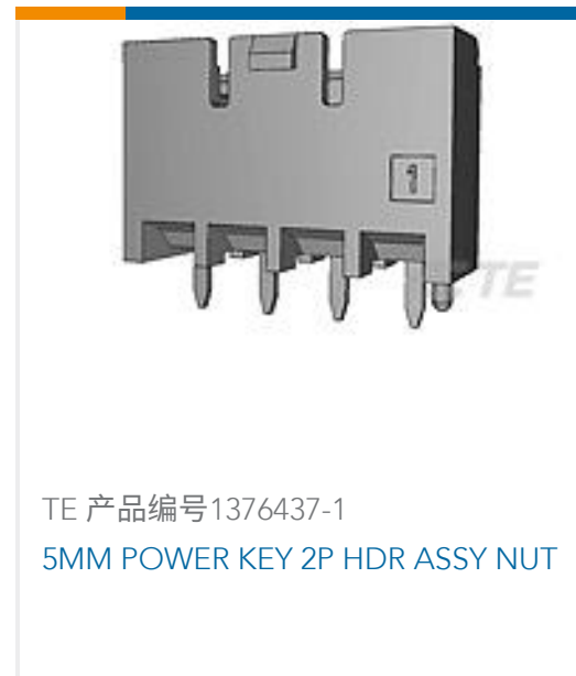
TE 产品编号1376437-1 5MM POWER KEY 2P HDR ASSY NUT