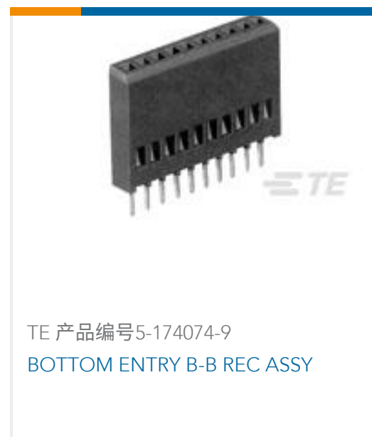
TE 产品编号5-174074-9 BOTTOM ENTRY B-B REC ASSY