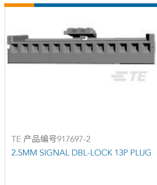
TE 产品编号917697-2 2.5MM SIGNAL DBL-LOCK 13P PLUG